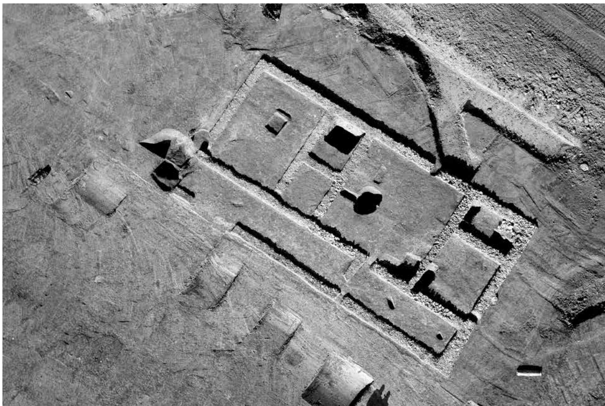
Fig. 2. Vue d'ensemble du corps de logis de la villa d'Allaines.

répartition des murs intérieurs épouse en partie les limites de certaines structures plus anciennes (cellier, cuvette). Une nouvelle cave (bâtiment D) construite en matériaux de récupération est installée à proximité du fossé en U. Un puits ainsi qu'un nouvel ensemble de fours circulaires sont également aménagés au centre de la cour.