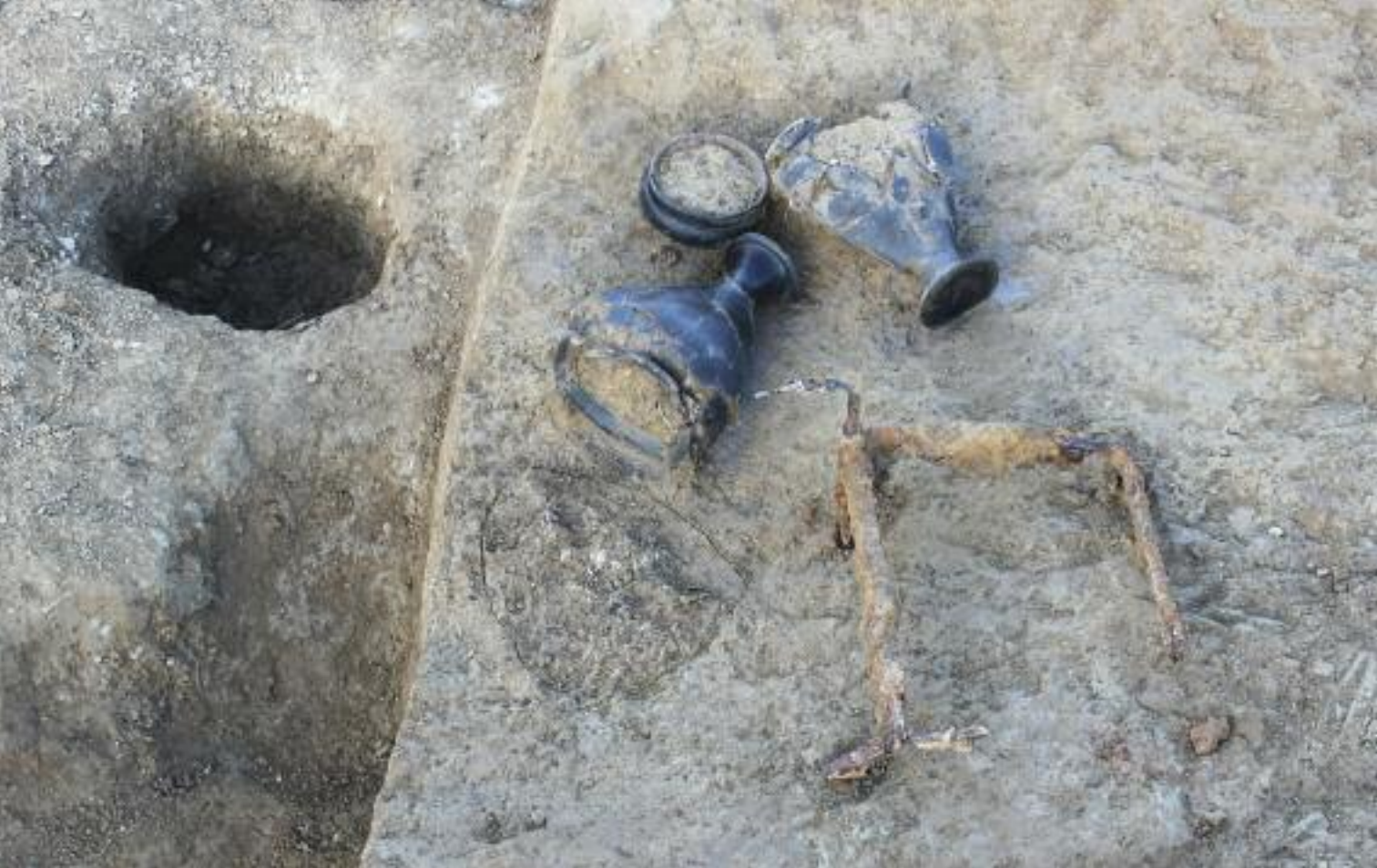
▲ Fig. 2 : L'amas osseux et le mobilier associé de la tombe 2, vus du sud.