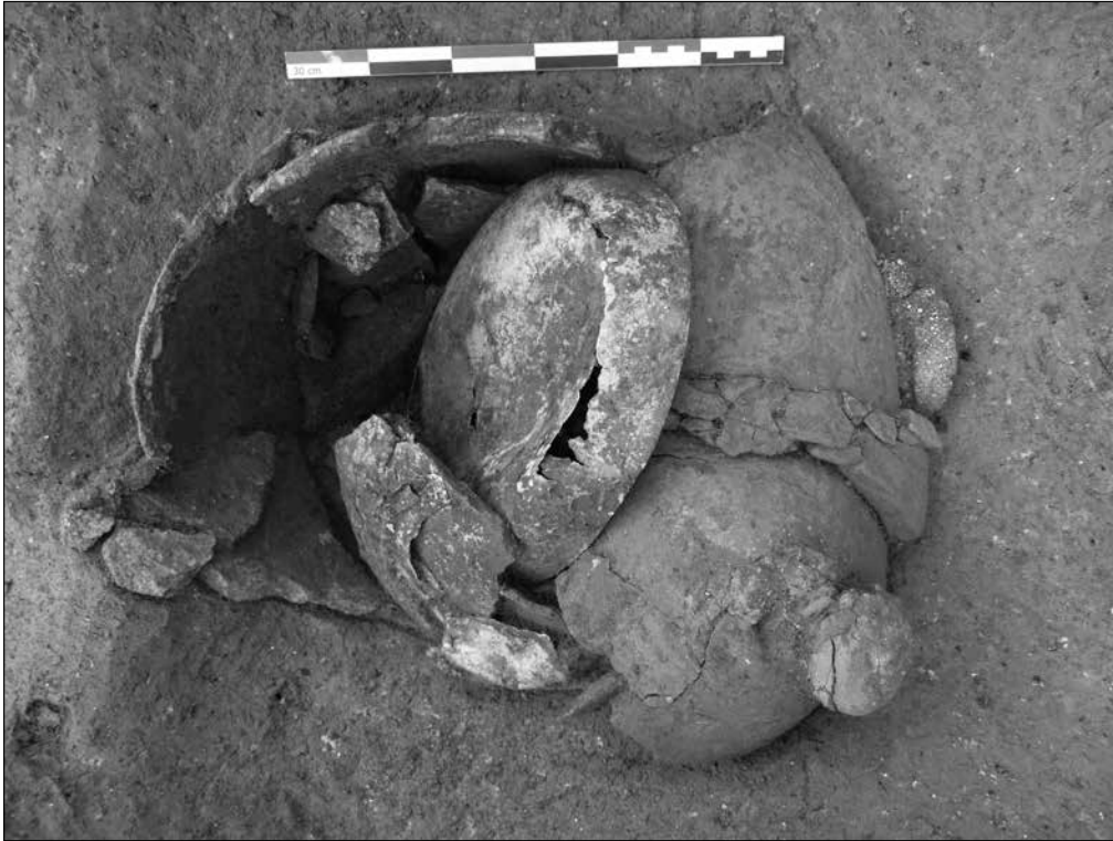
Fig. 2. Vue d'un dépôt secondaire de crémation en cours de fouille à Saint-Pierre sud.

La richesse des dépôts associés aux sépultures et la mise en scène de cet espace funéraire laissent envisager que les personnes incinérées devaient avoir un statut social élevé.