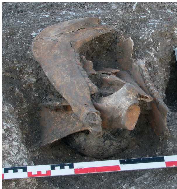
Fig. 5. L'inhumation SP 760 en vase, clos par des os de cheval et de bœuf (Reims, A. Thomann).

Au dernier tiers du III e et au début du IV e siècle, sur l'ensemble de l'aire funéraire se développe la sépulture en coffrage de bois pour immatures et adultes, creusée parfois très profondément, associée à du mobilier céramique (gobelet en métallescente, cruche de céramique claire), à des dépôts de chaussures (dans cinq cas), et à la présence d'un coffrage en plâtre à l'intérieur du coffrage en bois (dans trois cas). Certaines sépultures ont