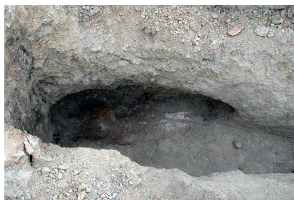
Fig. 6. Détail montrant la niche creusée dans la paroi nord-est de la tombe SP 48 (inhumation perturbée), destinée à accueillir le cercueil. Au fond, sont visibles des traces de bois, quelques clous de cercueil en place et des traces du plâtre qui remplissait le contenant.

Enfin, un enclos fossoyé quadrangulaire, probablement à vocation culturelle ou funéraire, a été créé à la fin du III e siècle, voire au début du IV e siècle, et clôt l'utilisation de la voie située sur le comblement du fossé de l'enceinte.