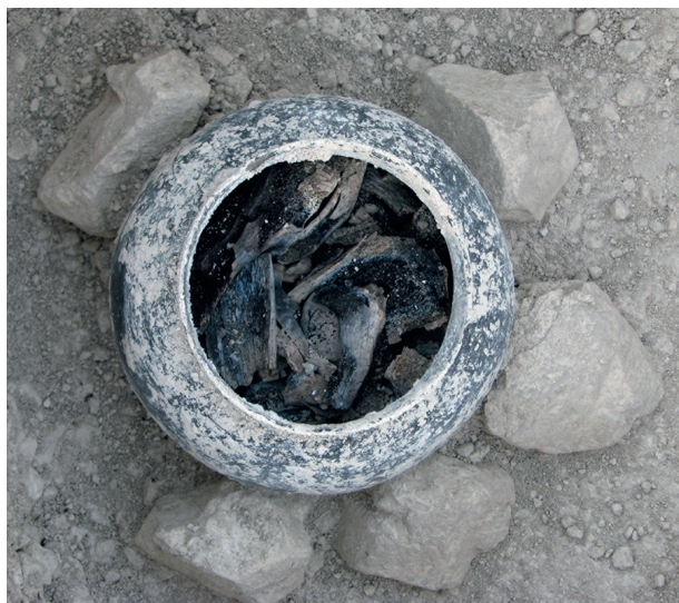
Fig. 3. Cliché in situ de la crémation du III e siècle située dans le comblement du fossé de la grande enceinte (Reims, A. Thomann).

- D'une part, deux cas de dépôts canins complets sont associés à des sépultures de nourrissons, dans des fosses qui jouxtent les sépultures concernées. En outre,