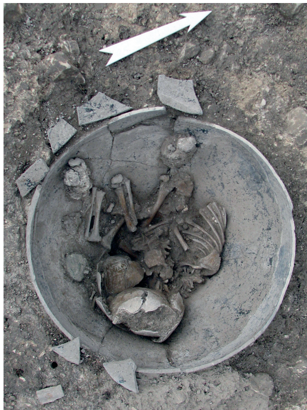
Fig. 4. Inhumation d'enfant en vase du III e siècle avec une monnaie d'Antonin le Pieux (Reims, A. Thomann).

des portions de chiens sont déposées dans d'autres sépultures avec des individus immatures plus âgés (5 à 19 ans).