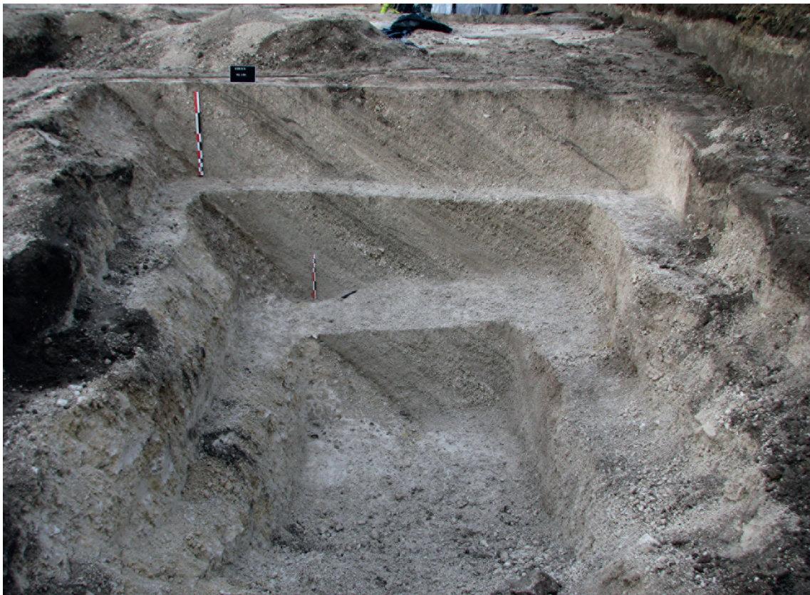
Fig. 7. Vue en coupe du fossé de la grande enceinte d'époque « augustéenne » (Reims, A. Thomann).

Ainsi, malgré de nombreuses perturbations liées aux fouilles du XIX e siècle et à la Grande Guerre, l'étude des dix-sept crémations et des quatre-vingt-deux inhumations a permis de montrer que la crémation est le premier mode utilisé autour du changement d'ère sur cette parcelle, et que les structures funéraires sont sans doute placées le long du bord interne du fossé de la grande enceinte. Le II e siècle est peu documenté rue de Sébastopol, comme dans de nombreux sites de Reims, mais, dès le III e siècle, inhumations et crémations sont utilisées simultanément et sous différentes formes : crémations en vase et dépôts de résidus de crémation en fosse, inhumations d'enfants en vase ou dans des contenants souples de forme circulaire, accompagnées de dépôts animaux et monnaies, inhumations en fosses quadrangulaires, parfois en niche et souvent très profondes, avec du mobilier d'accompagnement. À cette période, une fois le fossé comblé, c'est l'ensemble de l'emprise qui est utilisé à des fins funéraires.