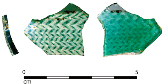
Fig. 3.- Vues des différentes faces du tesson

transparence avec le retour du filet blanc opaque en arrière plan. En partie supérieure, la première baguette a conservé sa forme circulaire en relief et délimite la fin du décor.