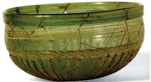
Fig. 4.- Vue de l'exemplaire complet de Valsgärde.

Le recours au décor à base de baguettes de verre coloré torsadé a facilité la recherche de comparaison. La technique bien connue sous l'Antiquité, ne se retrouve que sur trois formes typologiques durant le haut Moyen Age : les gobelets tronconiques étroits, les gobelets à profil en cloche allongée et les coupes basses ouvertes. Ces dernières, connus sous la dénomination de « type Valsgärde », possèdent un décor de baguettes rayonnantes à partir du fond. Mais elles sont aussi les seules à avoir en partie supérieure le bandeau de baguettes horizontales collées. Grâce à ce détail, il est donc possible d'attribuer le petit éclat de Bressilien à cette forme particulière, bien définie à partir du seul exemplaire complet découvert à ce jour dans une tombe-bateau (tombe 6) du cimetière viking d'Uppsala à Valsgärde (Suède) (fig. 4). D'un point de vue stylistique, les similitudes les plus proches du fragment de Bres-