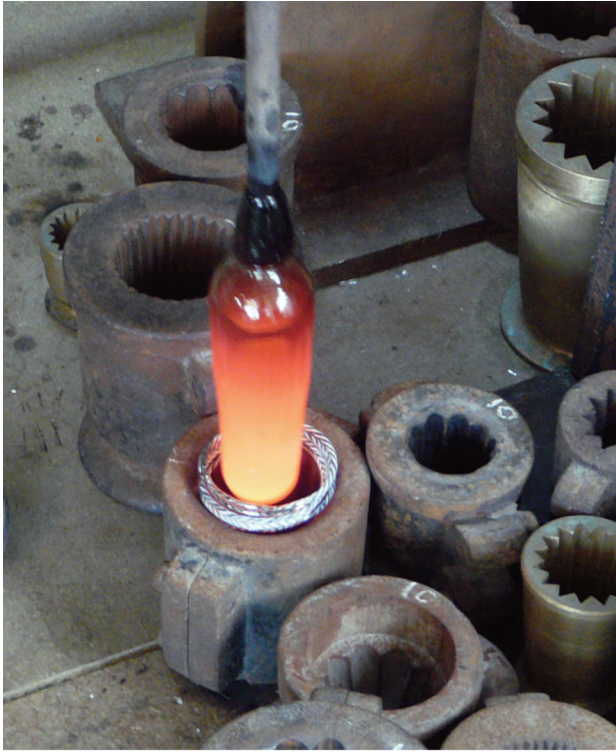
Fig. 5.- Vue de la prise des bracelets du décor horizontal avec la paraison (réalisation : F. Arnaud, cliché : F. Labaune-Jean, Inrap).