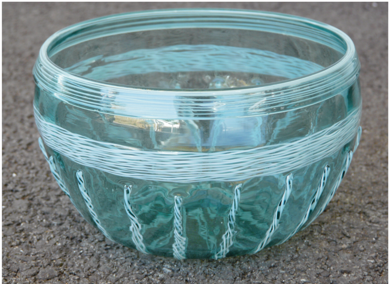
Fig. 7.- Vue de la coupe expérimentale terminée (réalisation : F. Arnaud).