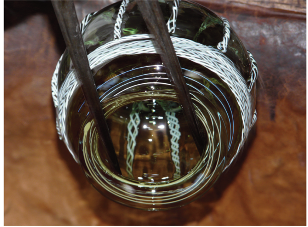
Fig. 6.- Vue de l'ouverture de la coupe et de la réalisation de la lèvre ourlée (réalisation : F. Arnaud).