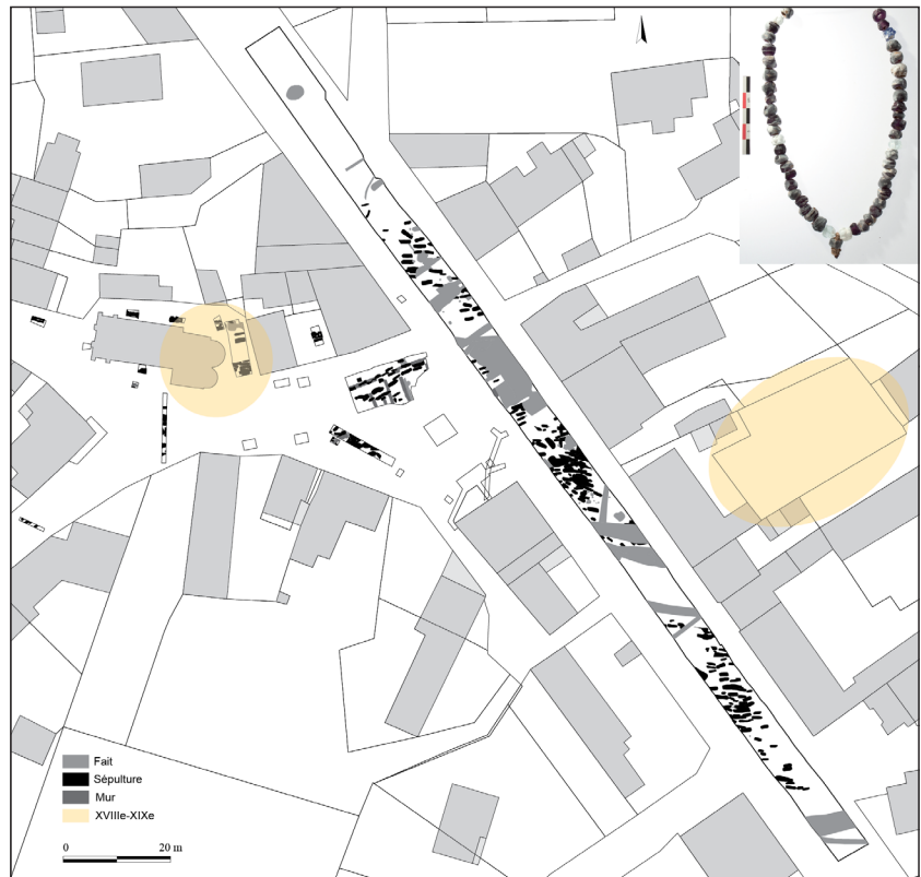
Fig. 9 - Plan de localisation des découvertes archéologiques dans le bourg de Sainte-Lizaigne (36) et hypothèse de l'emprise funéraire médiévale. (B. Marsollier, Inrap)