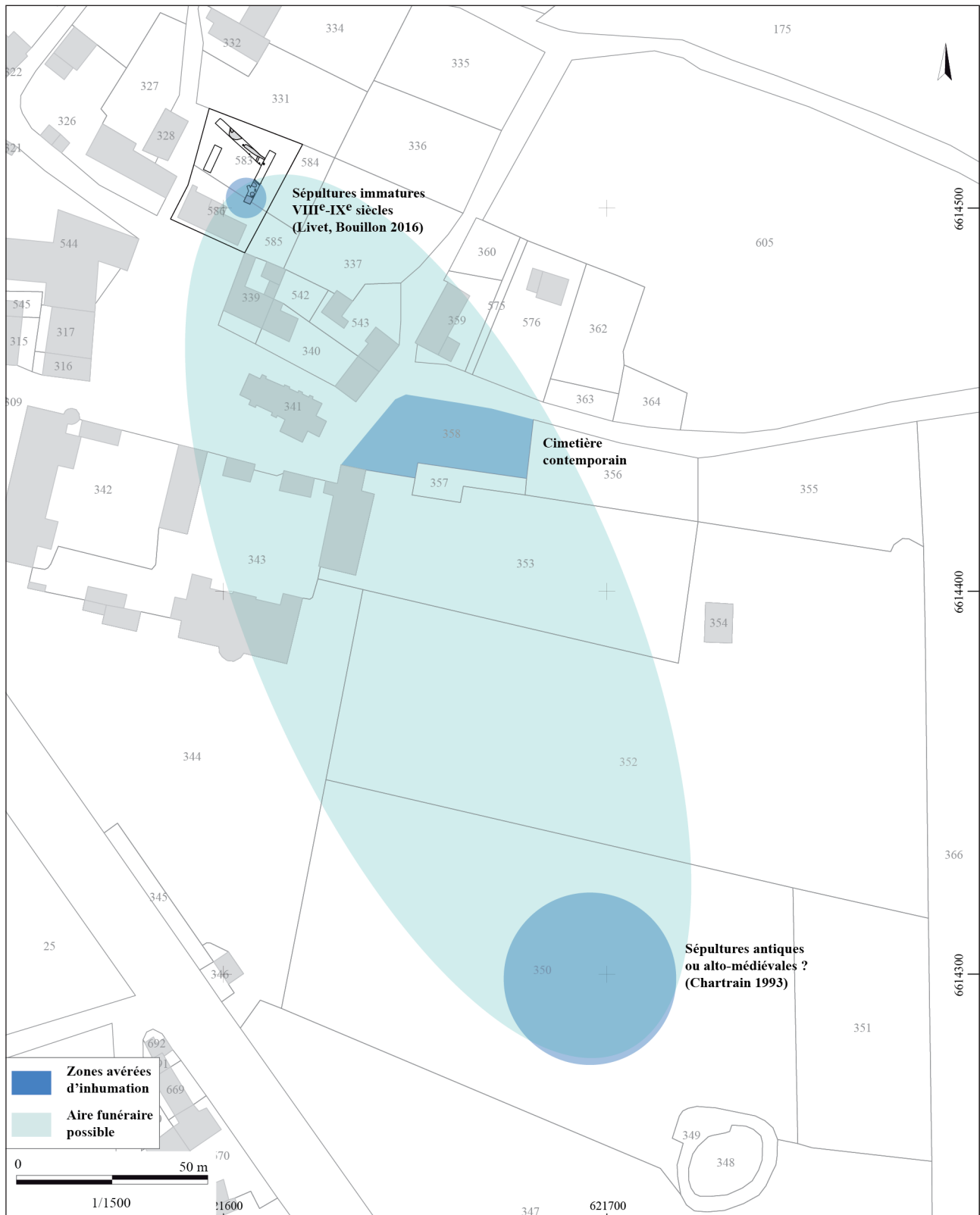
Fig. 3 - Plan de localisation des découvertes funéraires dans le bourg de Nohant (Nohant-Vic, 36). (B. Marsollier, Inrap)