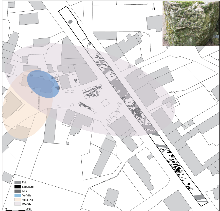
Fig. 7 - Hypothèse de l'emprise funéraire de Vic au second Moyen Âge, avec photo d'une bouteille à eau bénite (diagnostic 2010). (I. Pichon et J. Livet, Inrap)