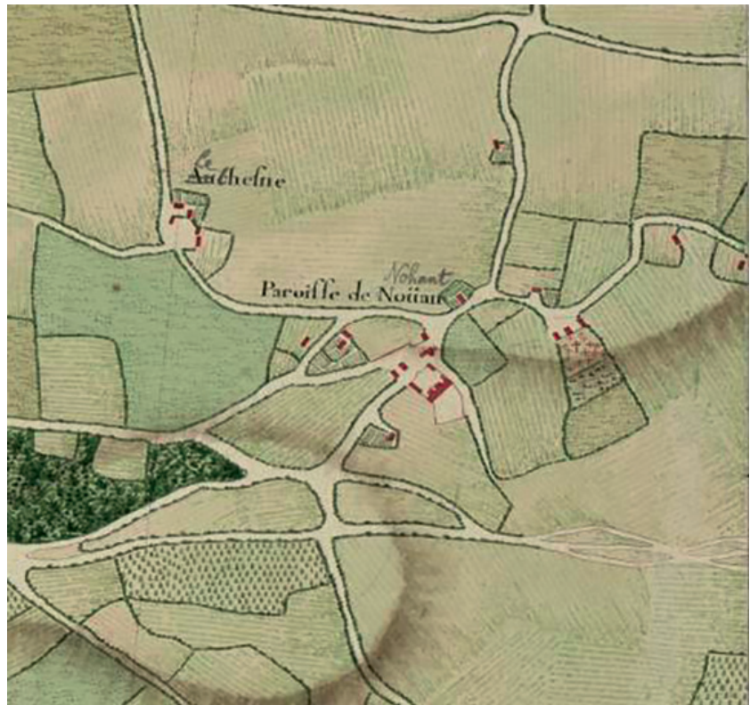
Fig. 10 - Extrait de l'Atlas Trudaine, généralité de Bourges, n°24, chemin de Châteauroux à La-Châtre (1745-1780) (nord à gauche).