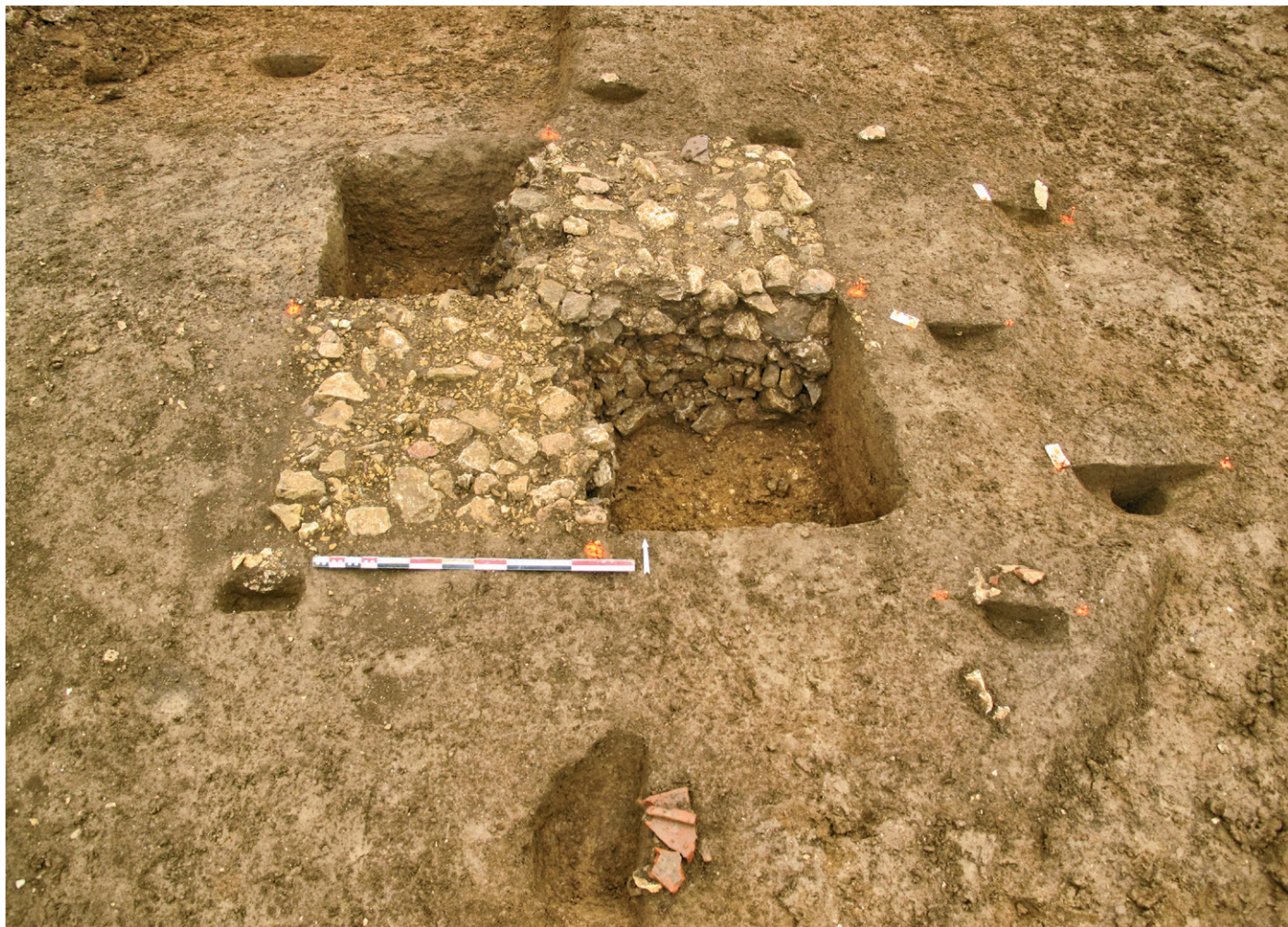
Fig. 2. Beire-le-Châtel (Côte-d'Or). Vue générale des fondations de l'édicule et des trous de poteau alentours, en cours de fouille. Vue vers le nord.