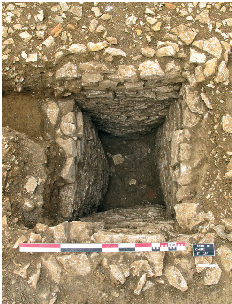
Fig. 3. Beire-le-Châtel (Côte-d'Or). Latrines en cours de fouille. Cette structure maçonnée est située contre le mur de clôture sud, récupéré en même temps que la partie supérieure des latrines.