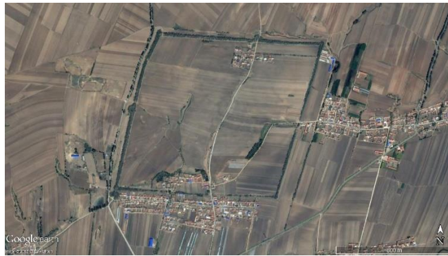
III. 2 Vue satellite du site de Pianliancheng.

ville dans le parcellaire : deux villages se nomment « village de la porte nord », « village de Pianliancheng ».