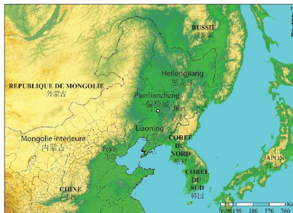
Ill. 1 Carte de localisation du site de Pianliancheng dans la plaine de Mandchourie.

Il s’agit d’un site fortifié traditionnellement daté des dynasties Liao (916-1125) et Jin (1115-1234), correspondant à l’ancienne cité Jin de Hanzhou (Jilin, 1984 ; Duan, 1985). En 1956, six tombes à chambres en brique (ovales et rectangulaires, certaines à inhumation et d’autres à incinération) ont été fouillées. De nombreuses prospections ont suivi et beaucoup d’objets ont été découverts : sceaux (Tian, 2013), statuettes, miroirs et cloches en bronze, étriers en fer, céramiques, grès à couverte, terres cuites architecturales, objets en os (Jilin, 1958 ; Jilin, 1963), etc. En 2015, la réfection de la route et du fossé d’évacuation d’eau situés au centre de la ville a donné lieu à une opération de carottage et à la fouille d’une parcelle de 500 m 2 .