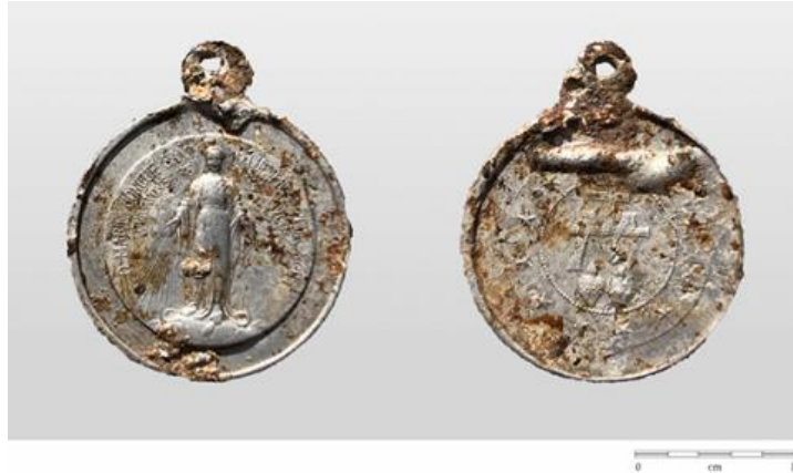
Médaille miraculeuse découverte dans une tombe (n. 14, secteur nord).