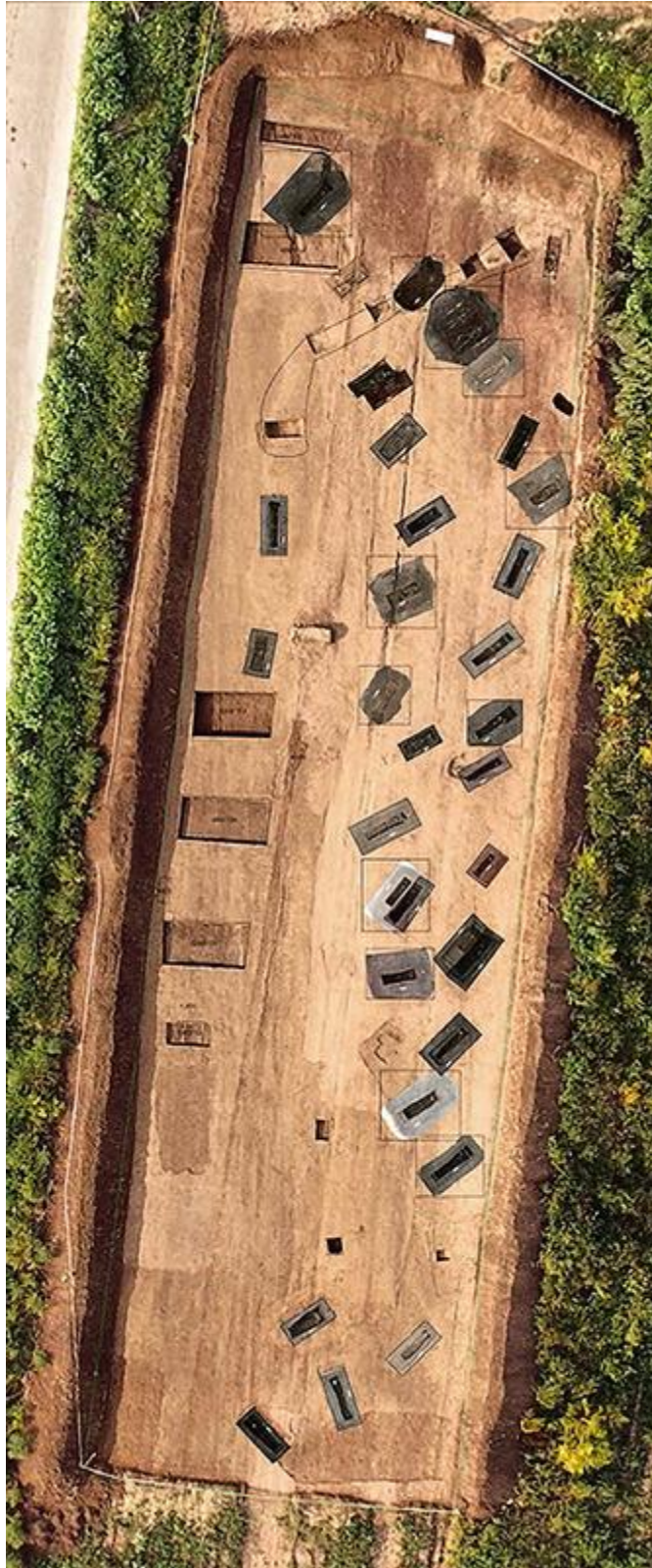
Photographie aérienne et orthophotos des tombes du secteur nord du cimetière de Pianliancheng.