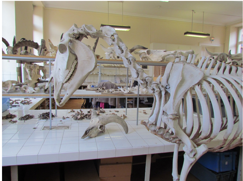
Fig. 1 - Vue de l'ostéothèque du Musée zoologique de Strasbourg.

besoin de disposer d'images en très haute définition d'ossements d'animaux, réunis sous la forme d'un atlas ostéologique inspiré de ceux auxquels ont recours la plupart des spécialistes en archéozoologie (Schmid, 1972 ; Pales & Lambert, 1971 ; Pales & Garcia, 1981 ; Barone, 1976). Par les nombreuses possibilités qu'elle offre (affichage, manipulation, enrichissement), l'imagerie 3D s'est imposée comme une solution adéquate pour la réalisation de cette collection ostéologique dématérialisée.