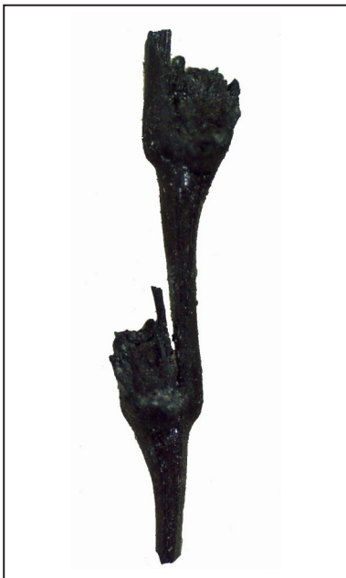
Fig. 5 - Exemple d'un segment de rachis de seigle ( Secale cereale ) constitué de plusieurs entrenœuds. (B. Pradat, Inrap)

de livrer dans les rapports les informations les plus précises possibles sur les modes de quantification des macrorestes. Le nombre minimum d'individus (NMI) correspond à l'estimation du nombre de grains entiers présents dans l'échantillon. Son mode de calcul doit être expliqué précisément : estimation directe, calcul des restes entiers et fragmentés, etc.