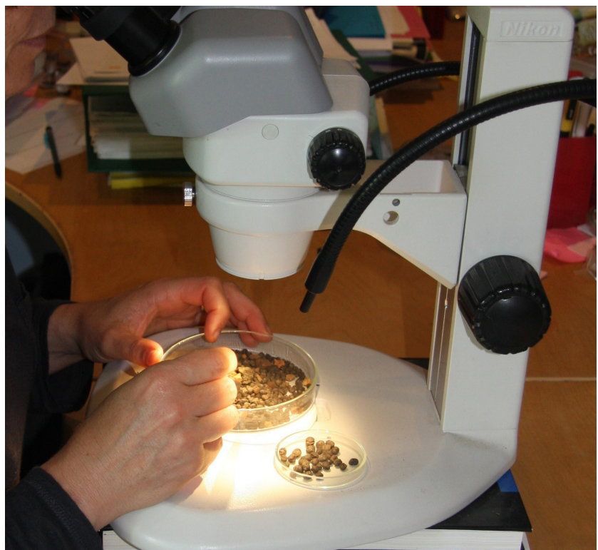
Fig. 2 - Un carpologue en phase de tri des restes carpologiques sous loupe binoculaire, à l'aide de pinces spécifiques.