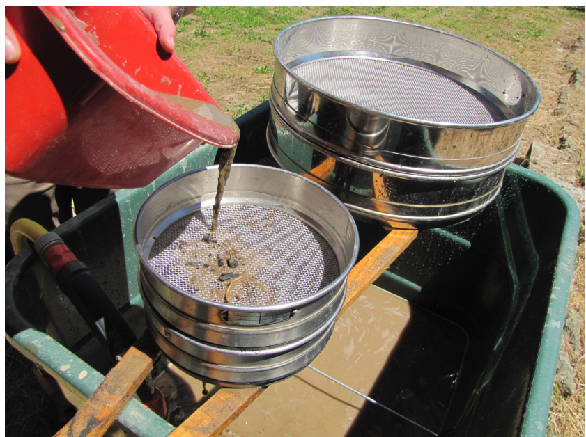
Fig. 1 - Une des techniques de tamisage : la flottation, qui permet d'extraire les éléments carbonisés du sédiment.

Le tamisage est une des étapes primordiales qui conditionne la qualité de l'étude carpologique [fig. 1]. La méthode utilisée (flottation manuelle ou mécanique, tamisage à l'eau, flottation suivie d'un tamisage à l'eau), qui dépend des volumes à traiter, du matériel dont on dispose, voire de la fossilisation des carporesses attendue, doit être spécifiée, tout comme le diamètre des mailles utilisé. Si, de manière générale, il s'agit de mailles de 2 ou 0,5 mm, divers cas spécifiques peuvent se présenter et nécessiter l'usage de mailles différentes.