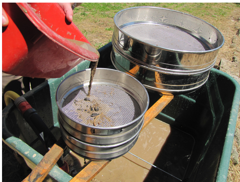
Fig. 1 - Une des techniques de tamisage : la flottation, qui permet d'extraire les éléments carbonisés du sédiment.

Le tamisage est une des étapes primordiales qui conditionne la qualité de l'étude carpologique [fig. 1]. La méthode utilisée (flottation manuelle ou mécanique, tamisage à l'eau, flottation suivie d'un tamisage à l'eau), qui dépend des volumes à traiter, du matériel dont on dispose, voire de la fossilisation des carporesses attendue, doit être spécifiée, tout comme le diamètre des mailles utilisé. Si, de manière générale, il s'agit de mailles de 2 ou 0,5 mm, divers cas spécifiques peuvent se présenter et nécessiter l'usage de mailles différentes.