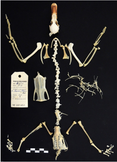
Fig. 5 - Squelette de sarcelle d'hiver préparé par le taxidermiste. (Frédéric Poupon, Service Archéologique du Grand Reims, 2020)

Le choix des animaux préparés demeure néanmoins totalement aléatoire puisqu'il dépend entièrement des dons réalisés auprès du service. Seule la multiplication des contacts (LPO, autres parcs animaliers) permettrait de diversifier la nature des taxons. Par ailleurs, lors de ces premières préparations, les animaux stockés depuis plusieurs années dans des congélateurs présentaient des problèmes d'autolyse conduisant parfois à une moins bonne qualité des préparations ostéologiques. Par conséquent, il faudrait également privilégier la collecte d'animaux décédés récemment. Face à la difficulté d'accéder à certaines espèces, notamment celles protégées, et afin de pouvoir sélectionner les spécimens ciblés, une réflexion sur la possibilité de réaliser des moulages de squelettes de référence est actuellement envisagée mais pose différentes questions. Quel coût ? Quel prestataire ? Quelles sont les modalités de prêt de squelettes de référence pour le moulage ? À noter que cette technique permettrait également de régler les problèmes liés à la dégradation des graisses animales.