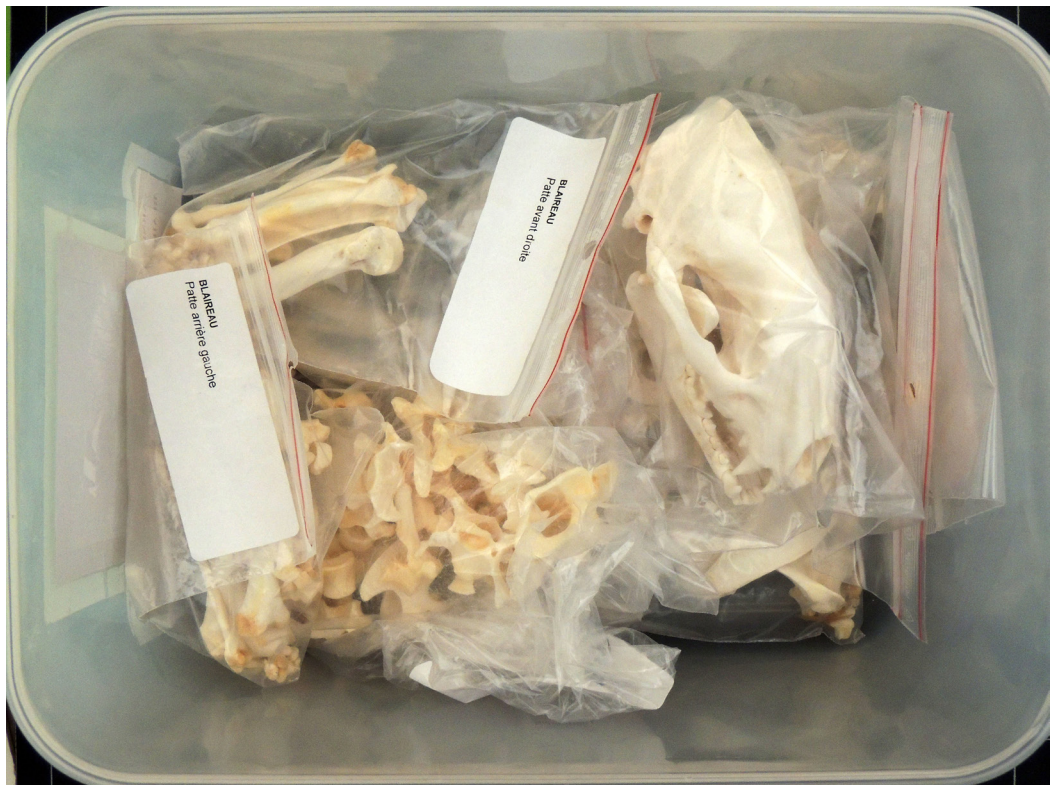
Fig. 6 - Squelette de blaireau préparé par le taxidermiste. (Frédéric Poupon, Service Archéologique du Grand Reims, 2020)