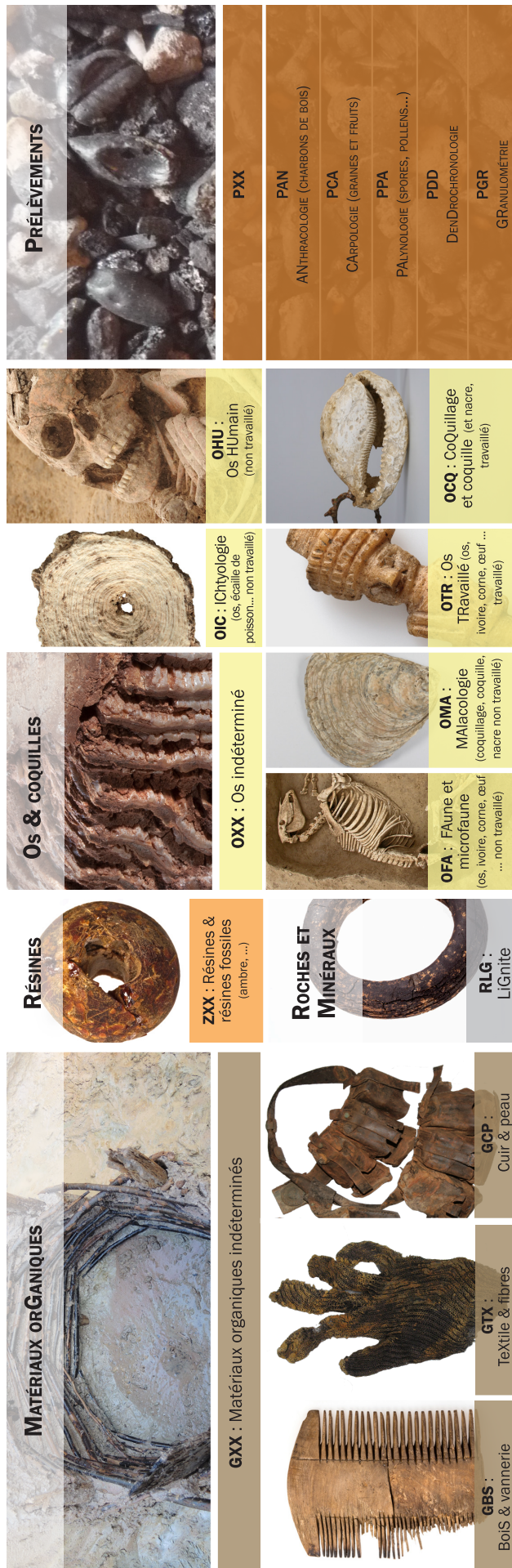
Fig. 4 - Codes mobilier appliqués aux biomatériaux conservés au CCE Alsace. (Agathe Mulot et Myriam Muesser, Archéologie Alsace, 2008)