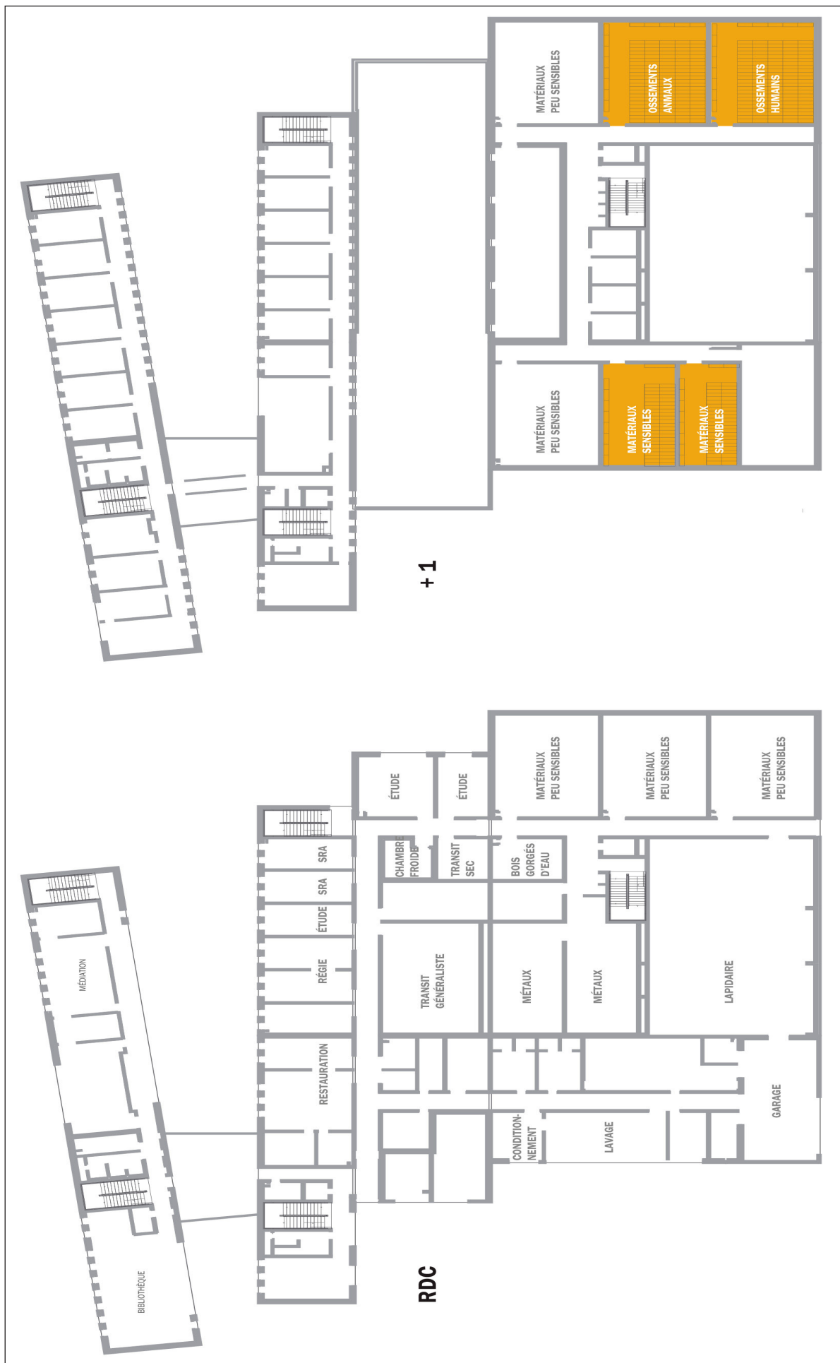
Fig. 3 - Localisation (en orange) des espaces de conservation des biomatériaux et artefacts composés de matériaux organiques au CCE Alsace. (Archéologie Alsace / W-Architectures, 2020)