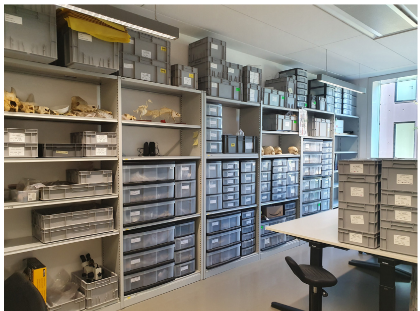
Fig. 7 - Salle d'étude pour les études ostéologiques du CCE Alsace avec collections de référence.

Quand l'étude ne peut pas être réalisée sur place, et notamment dans le cadre d'analyses des matériaux requérant des équipements spécifiques, il est possible d'effectuer une demande de sortie des restes à étudier ou d'un échantillon prélevé sur place, demande qui sera soumise à l'autorisation du SRA et après une première venue au CCE.