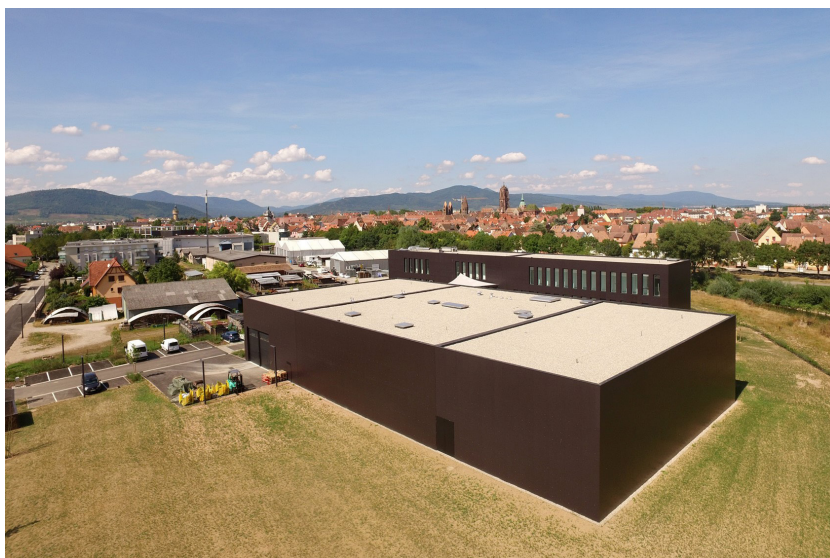
Fig. 1 - La section des dépôts du bâtiment mutualisé du CCE d'Alsace et d'Archéologie Alsace.

Suite à ce constat, les départements du Bas-Rhin et du Haut-Rhin se sont portés volontaires pour la création d'un équipement adapté à la préservation et à l'accessibilité des collections archéologiques alsaciennes. Le projet a été monté en partenariat avec le site de Strasbourg de la DRAC Grand Est (anciennement DRAC Alsace). Il a porté sur la création d'un nouveau bâtiment mixte comportant les locaux d'Archéologie Alsace (service d'archéologie interdépartemental dépendant des départements alsaciens) et un centre de conservation et d'études [fig. 1].