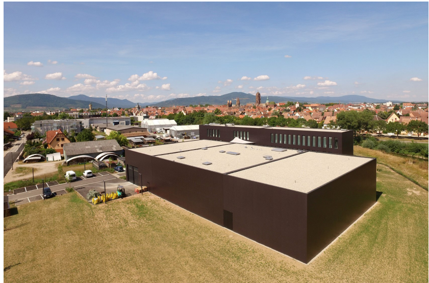
Fig. 1 - La section des dépôts du bâtiment mutualisé du CCE d'Alsace et d'Archéologie Alsace. (F. Basoge, Archéologie Alsace)

Suite à ce constat, les départements du Bas-Rhin et du Haut-Rhin se sont portés volontaires pour la création d'un équipement adapté à la préservation et à l'accessibilité des collections archéologiques alsaciennes. Le projet a été monté en partenariat avec le site de Strasbourg de la DRAC Grand Est (anciennement DRAC Alsace). Il a porté sur la création d'un nouveau bâtiment mixte comportant les locaux d'Archéologie Alsace (service d'archéologie interdépartemental dépendant des départements alsaciens) et un centre de conservation et d'études [fig. 1].