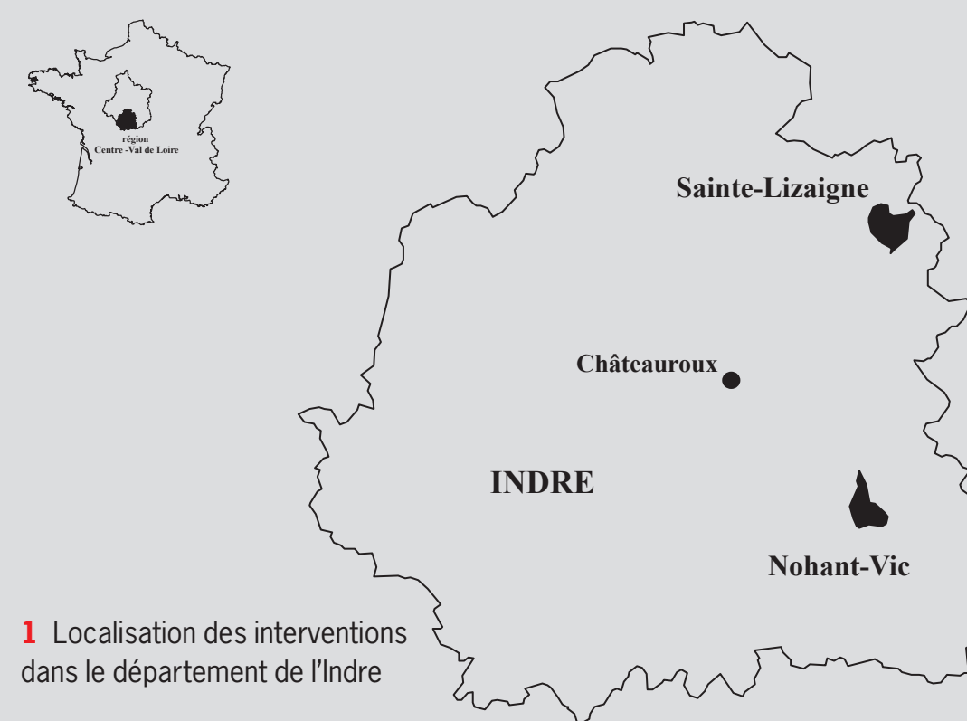
1 Localisation des interventions dans le département de l'Indre