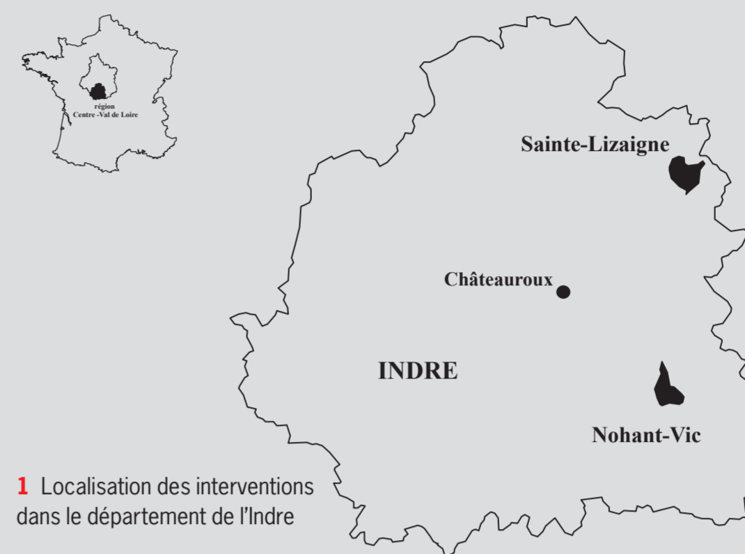
1 Localisation des interventions dans le département de l'Indre