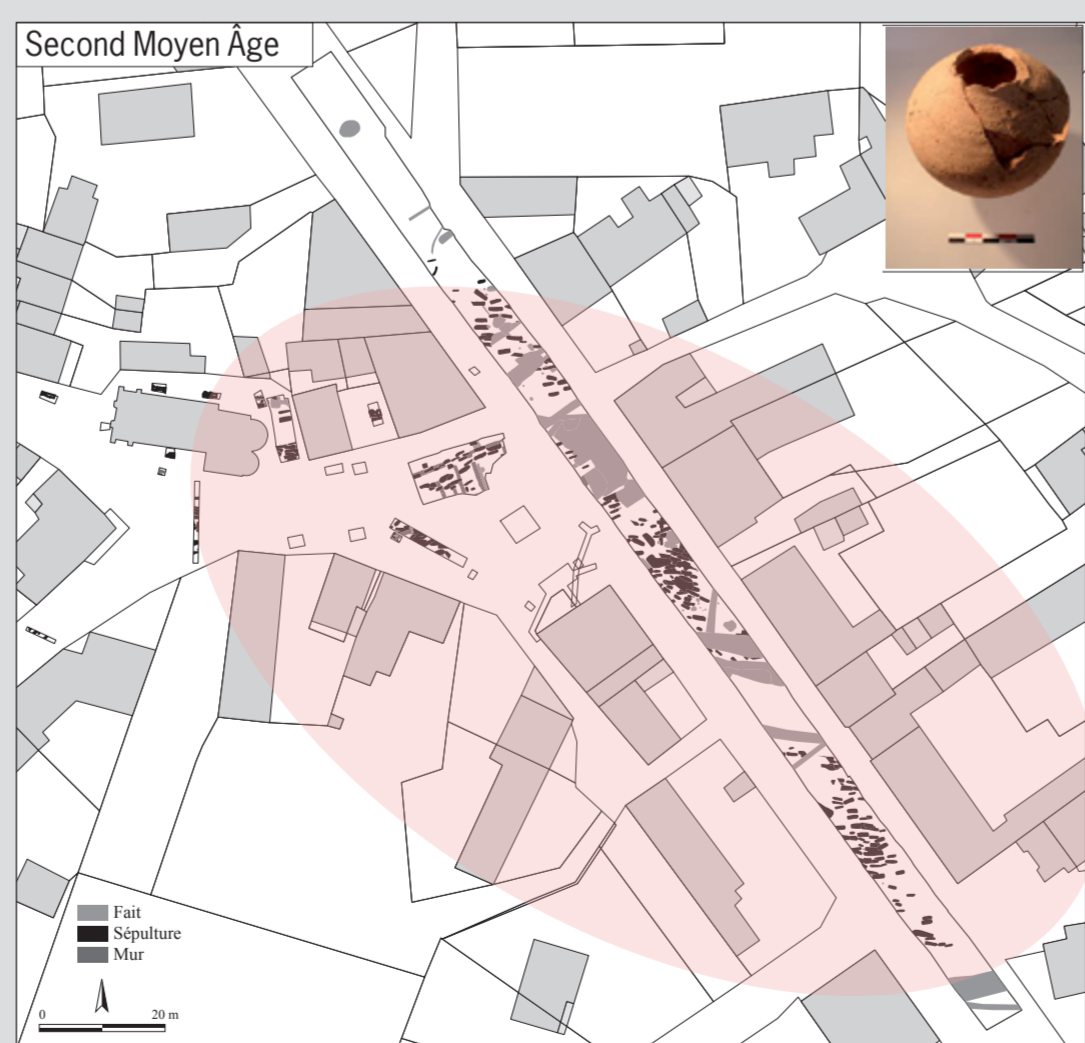
6 Hypothèse de l'emprise de l'aire sépulcrale du second Moyen Âge de Vic (Indre), photographie d'une fiole à eau bénite découverte en contexte funéraire des XIII e -XIV e siècles (diagnostic de 2011).