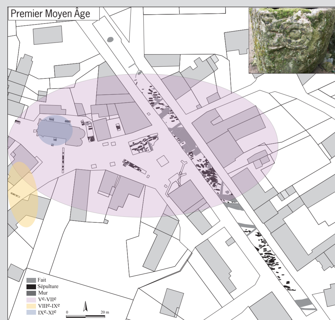
5 Hypothèse de l'emprise de l'aire sépulcrale du premier Moyen Âge de Vic (Indre), photographie d'un sarcophage (diagnostic de 2011).