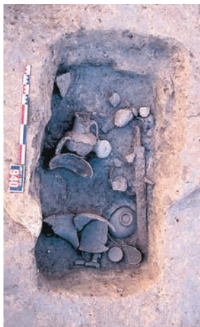
Fig. 4. Une tombe à incinération d'époque républicaine.