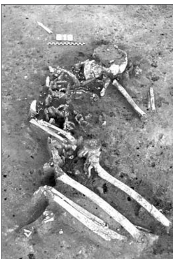
Fig. 3. Une sépulture néolithique (SP2162) riche en mobilier : 612 perles discoïdes, 400 dentales et 31 pendeloques.

En ce qui concerne les tombes elles-mêmes, on peut considérer qu'elles sont bien conservées et que le dépôt funéraire est complet. Deux d'entre elles sont richement dotées. La tombe 1236 a livré dix-sept vases et objets plus ou moins complets, pour