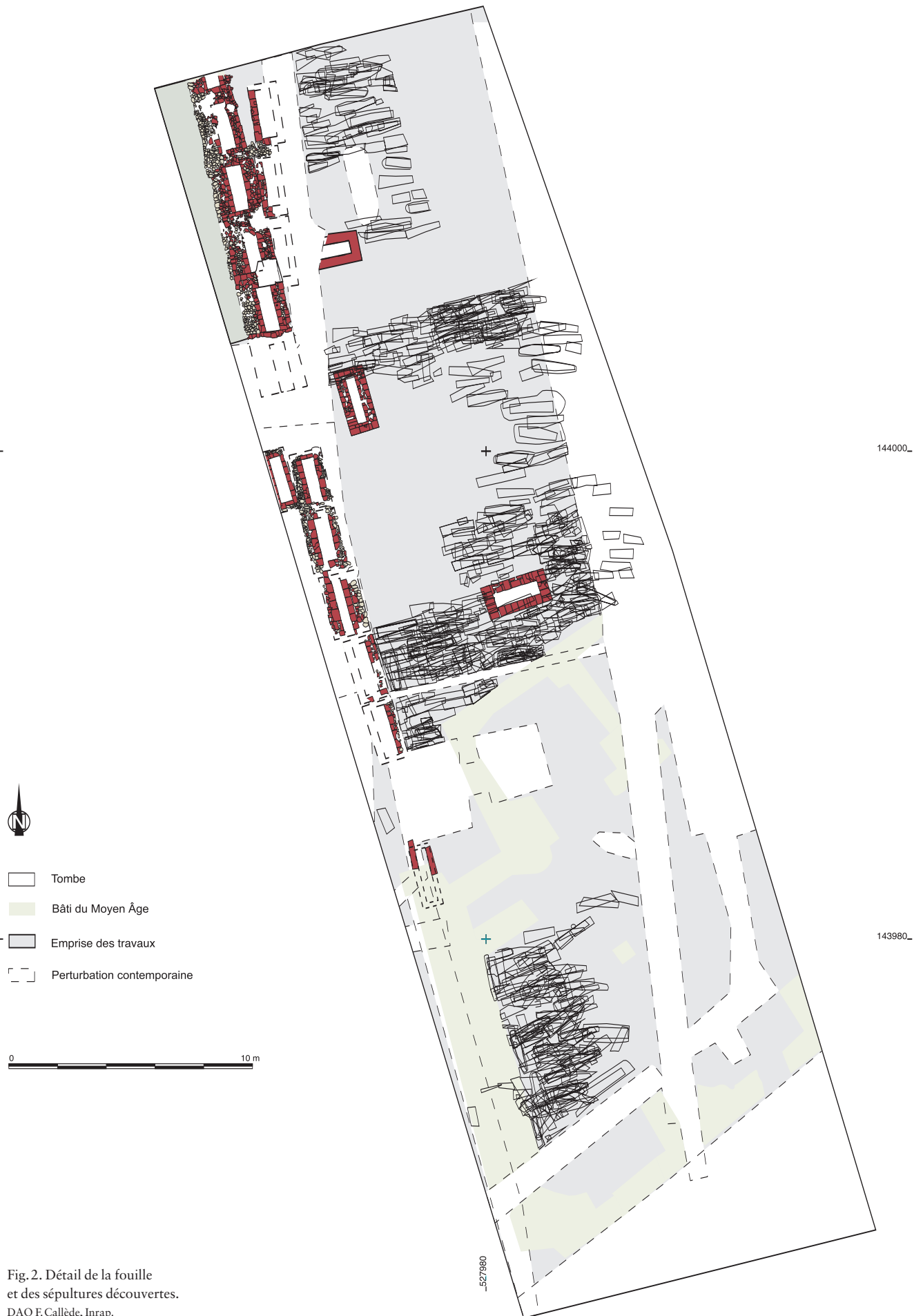
Fig. 2. Détail de la fouille et des sépultures découvertes. DAO F. Callède, Inrap.