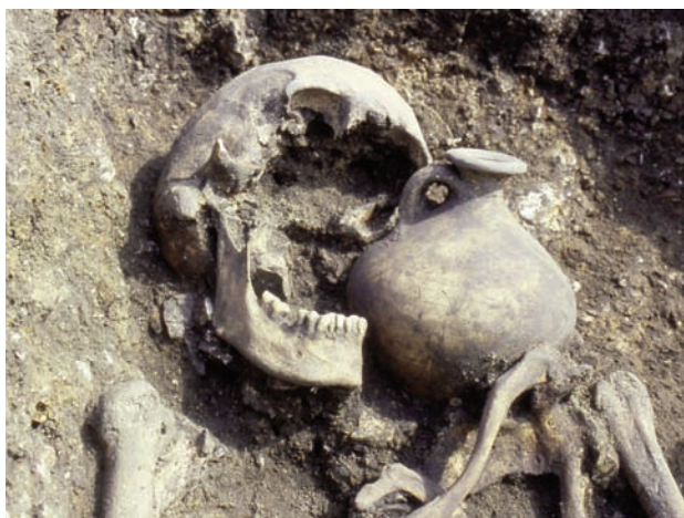
Fig. 2. Sépultures à inhumations du I er s. ap. J.-C.

À la fin des deux premières interventions, les tranchées ont été rebouchées. Cette action est indispensable pour protéger les structures des pillages et des intempéries lorsque la fouille a lieu plusieurs mois après le diagnostic. En revanche, le double décapage soumet les structures, et plus particulièrement les sépultures à crémation lorsque les urnes apparaissent au niveau du décapage, à un risque d'arasement supplémentaire. Il convient, lors du rebouchage des tranchées, de bien protéger les structures.