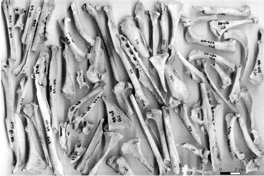
Fig. 2. État de conservation des ossements de cormoran de Socotra du site de Qal'at al-Bahreïn. Période Dilmoun récent (1000 à 500 avant J.-C.).

Le grand cormoran, de répartition plutôt septentrionale, est une espèce qui nidifie essentiellement à l'ouest et au nord de la Turquie, ainsi qu'au nord-est de l'Afghanistan. À la saison froide, celui-ci migre en Irak, dans le golfe Persique et dans le Bassin méditerranéen. Le cormoran de Socotra, de répartition plus méridionale, est une espèce qui nidifie volontiers dans les îlots du Golfe, qui constituent pour lui un habitat de prédilection.