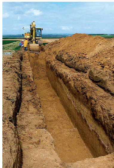
Fig. 1. Tranchée de diagnostic (Villers-Bretonneux, Somme).

La deuxième technique adaptée également au fort recouvrement sédimentaire est celle du sondage en pyramide inversée . Très dispendieuse en temps et moyens, présentant l'inconvénient majeur d'une difficile gestion des déblais et d'une importante emprise au sol, elle a pour avantage d'offrir la possibilité d'intervenir manuellement directement sur les vestiges archéologiques et d'assurer par un test une reconnaissance en plan du niveau. Parallèlement à cela, un relevé stratigraphique détaillé peut être obtenu grâce au relevé des différents fronts de palier. Les données ainsi collectées sont du même niveau