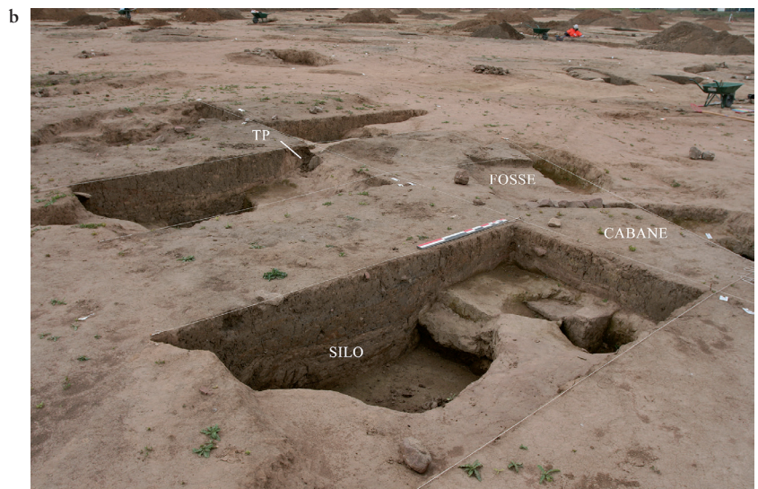
Fig. 4. (a) Ensemble constitué de trois cabanes semi-enterrées et de sept fosses se recoupant les unes les autres. Les creusements et leur stratigraphie ont été identifiés par le biais de plusieurs sondages qui ont dû être élargis en raison de l'imbrication des structures. La mini-pelle n'est intervenue ici qu'à la phase finale, pour dégager les banquettes et recueillir le mobilier qu'elles renfermaient. © M. Châtelet, Inrap. (b) Relevé en plan et en coupe des trois cabanes et des sept fosses. DAO A. Gelé, Pair; © M. Châtelet, Inrap.