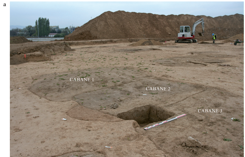
Fig. 3. (a) Sondage ponctuel préalable à la fouille à la mini-pelle, destiné à établir les liens stratigraphiques entre les différentes cabanes. © M. Châtelet, Inrap. (b) Grande fosse polylobée qui s'est avérée recouvrir divers creusements de nature différente. Ces creusements ont pu être individualisés grâce à une fouille manuelle en carroyage de la structure. © M. Châtelet, Inrap.