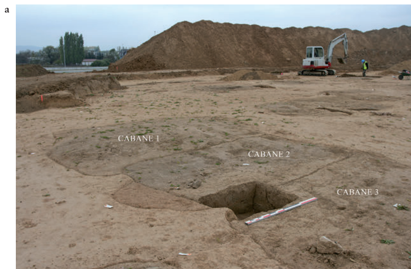
Fig. 3. (a) Sondage ponctuel préalable à la fouille à la mini-pelle, destiné à établir les liens stratigraphiques entre les différentes cabanes. © M. Châtelet, Inrap. (b) Grande fosse polylobée qui s'est avérée recouvrir divers creusements de nature différente. Ces creusements ont pu être individualisés grâce à une fouille manuelle en carroyage de la structure. © M. Châtelet, Inrap.