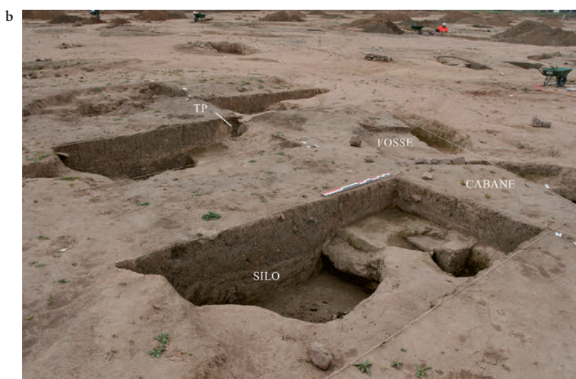
Fig. 4. (a) Ensemble constitué de trois cabanes semi-enterrées et de sept fosses se recoupant les unes les autres. Les creusements et leur stratigraphie ont été identifiés par le biais de plusieurs sondages qui ont dû être élargis en raison de l'imbrication des structures. La mini-pelle n'est intervenue ici qu'à la phase finale, pour dégager les banquettes et recueillir le mobilier qu'elles renfermaient. © M. Châtelet, Inrap. (b) Relevé en plan et en coupe des trois cabanes et des sept fosses. DAO A. Gelé, Pair; © M. Châtelet, Inrap.