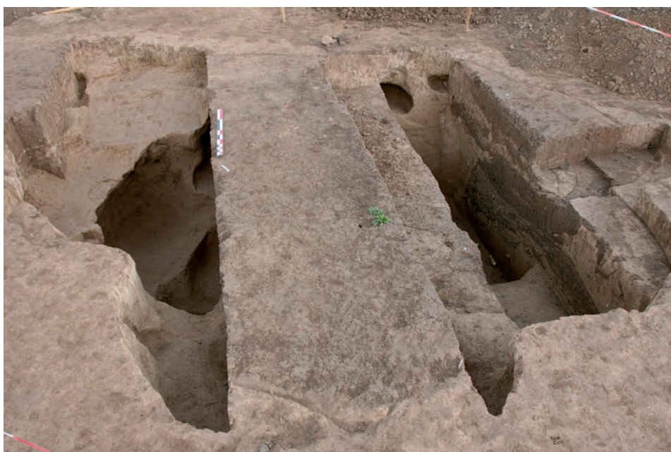
Fig. 6. Grande fosse d'extraction du limon, fouillée en associant les approches manuelle et mécanique. Son interprétation n'a pu être réellement établie qu'après avoir dégagé à la main l'un des côtés en mettant en évidence ses multiples creusements et les marches destinées à faciliter l'accès aux niveaux inférieurs.

Son recours sur un chantier ne peut être pour autant systématique et son utilisation doit être modulée en fonction des conditions particulières à chaque site, de ses problématiques scientifiques et du temps imparti à l'opération. À Marlenheim, la mini-pelle a été largement utilisée puisqu'elle a été présente pendant près de la moitié de l'opération. Intervenue dans une seconde approche du site, après une première phase de reconnaissance manuelle, elle a rarement été employée en continu. Dans la plupart des cas, son intervention a été associée à des contrôles et des finitions réalisés à la main, occasionnant des interruptions fréquentes de l'engin, mais nécessaires à la bonne compréhension des structures. Cette approche supposait une grande réactivité des fouilleurs et une équipe parfaitement informée des problématiques attachées au site et aux structures. Loin d'être systématique, le recours à la mini-pelle peut être ainsi assujéti à la réflexion scientifique et devenir un outil parfaitement adapté à nos besoins.