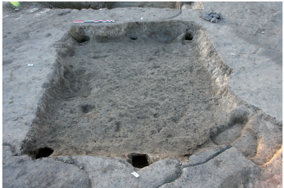
Fig. 5. (a) Dégagement du comblement d'une cabane semi-enterrée à la mini-pelle. Les déblais sont systématiquement triés à la main. © M. Châtelet, Inrap. (b) La cabane vidée de son comblement. © M. Châtelet, Inrap.