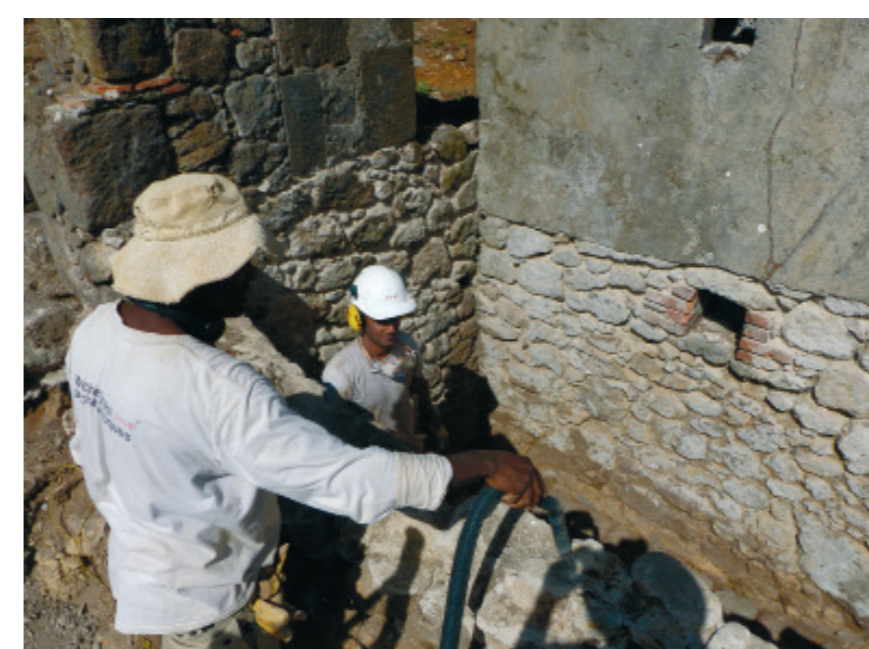
9. Étude du moulin à café de l'habitation Cantamerle, Capesterre belle-Eau, Guadeloupe.