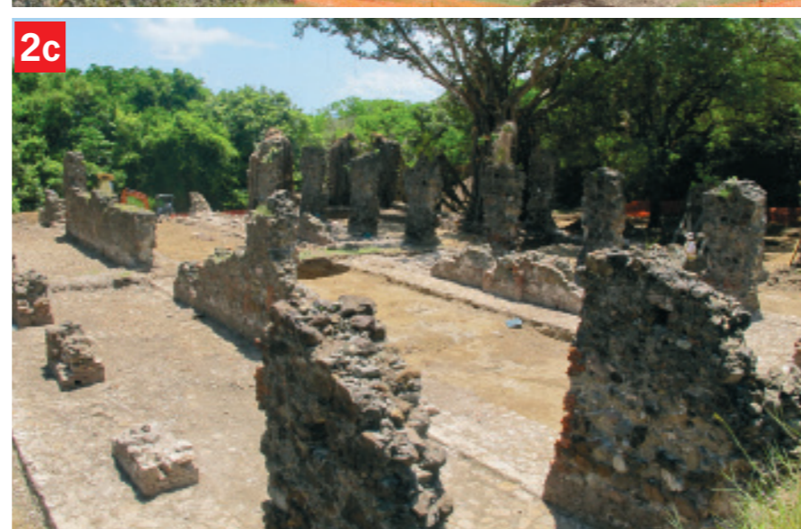
2. L'habitation la Caravelle, Trinité, Martinique : a Les entrepôts et jardin de la Caravelle. - b Les entrepôts. - c Poudrière, cachots, case à vent ? - d Intérieur d'une cellule avec aération en chicane.