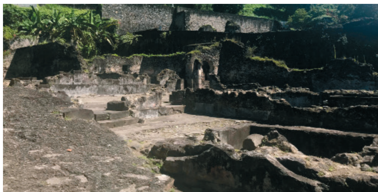
5. Le potentiel bâti de Saint-Pierre, Martinique. Les ruines de la prison.