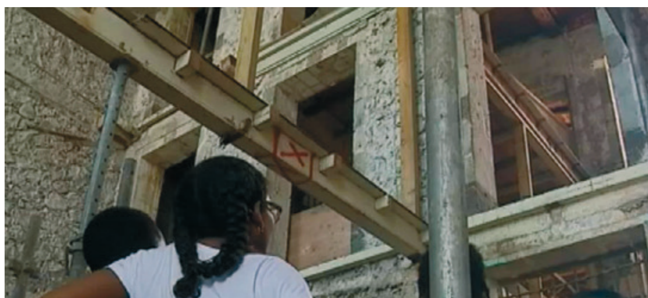
4. Maison Chapp, Basse-Terre, Guadeloupe.