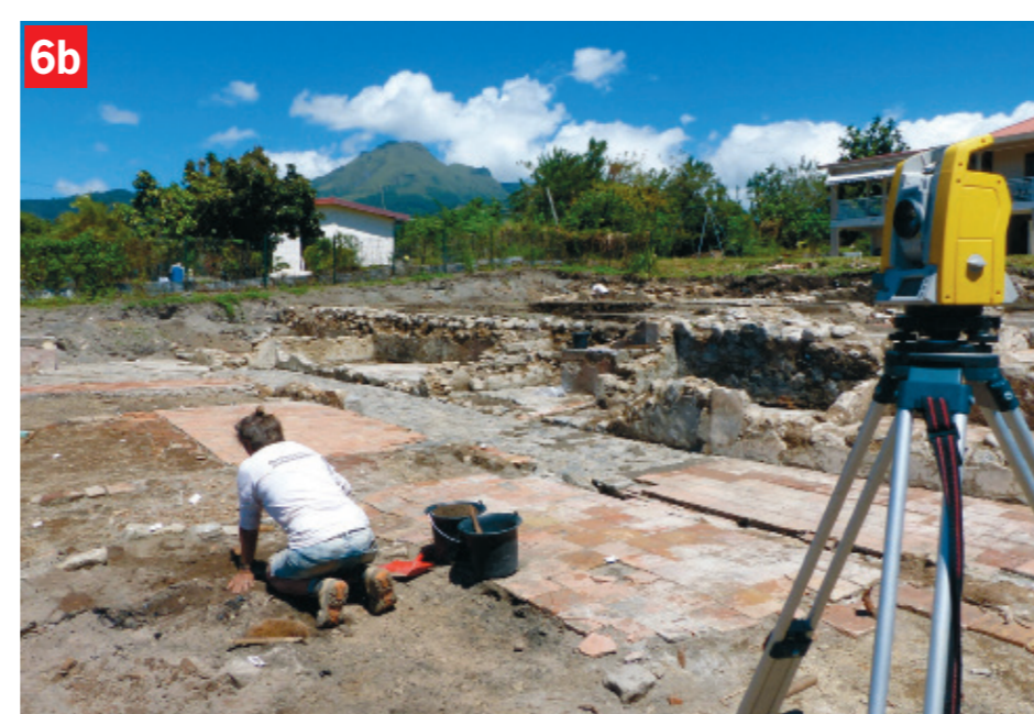
6. Rue d'Orléans, Saint-Pierre, Martinique : a © C. Mangier, Inrap - b © A. Jégouzo, Inrap