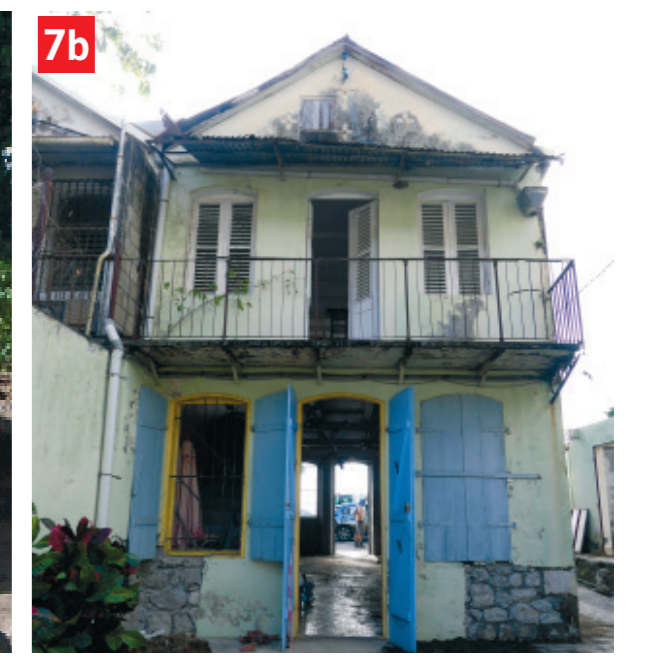
7. Constructions de la période coloniale et du XX e siècle. a Bunker de Tartenson, Fort-de-France, Martinique. - b Villa Sainte-Anne, Saint-Pierre, Martinique. Première étude d'un bâtiment post éruption.