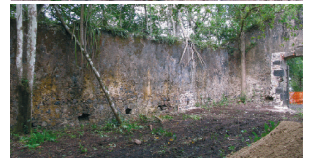
3. Magasin de l'habitation Vatable, Les Trois îlets, Martinique.