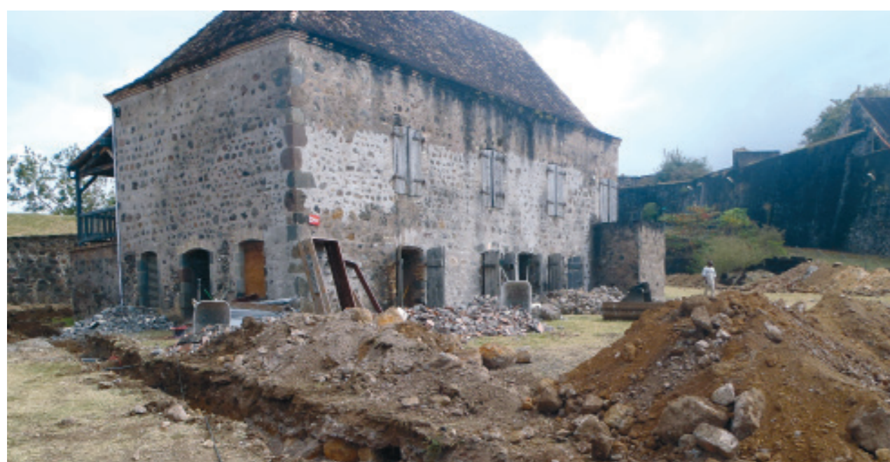
1. Le Fort Delgrès, Basse-Terre, Guadeloupe.