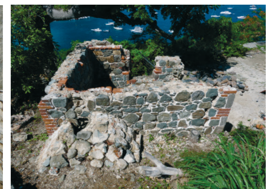
10. Étude du Fort Gustav, Gustavia, Saint-Barthélemy. La cuisine du Fort.