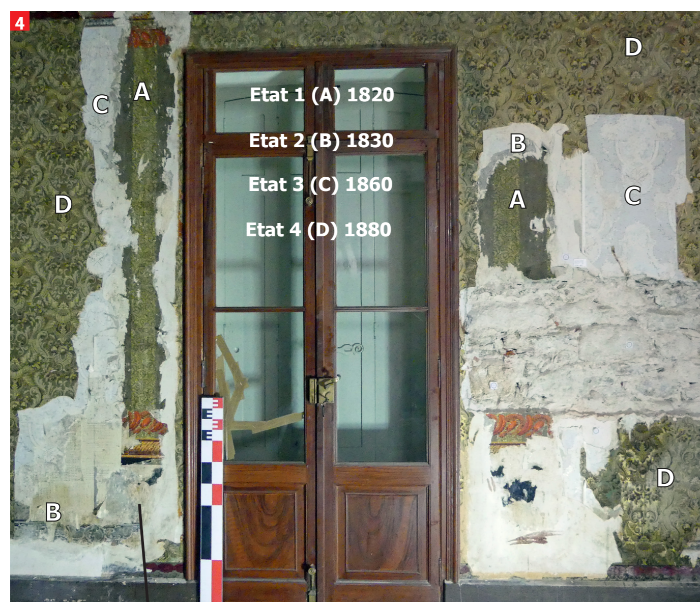
4 Stratigraphie de papiers peints du salon d'apparat liés aux différents réaménagements opérés en 1820, 1830, 1860 et 1880.

Cliché C. Jandot (Inrap). Datation papier peint : C. Vaxelaire, (Conservatrice du Musée européen du papier Peint de Rotheim).