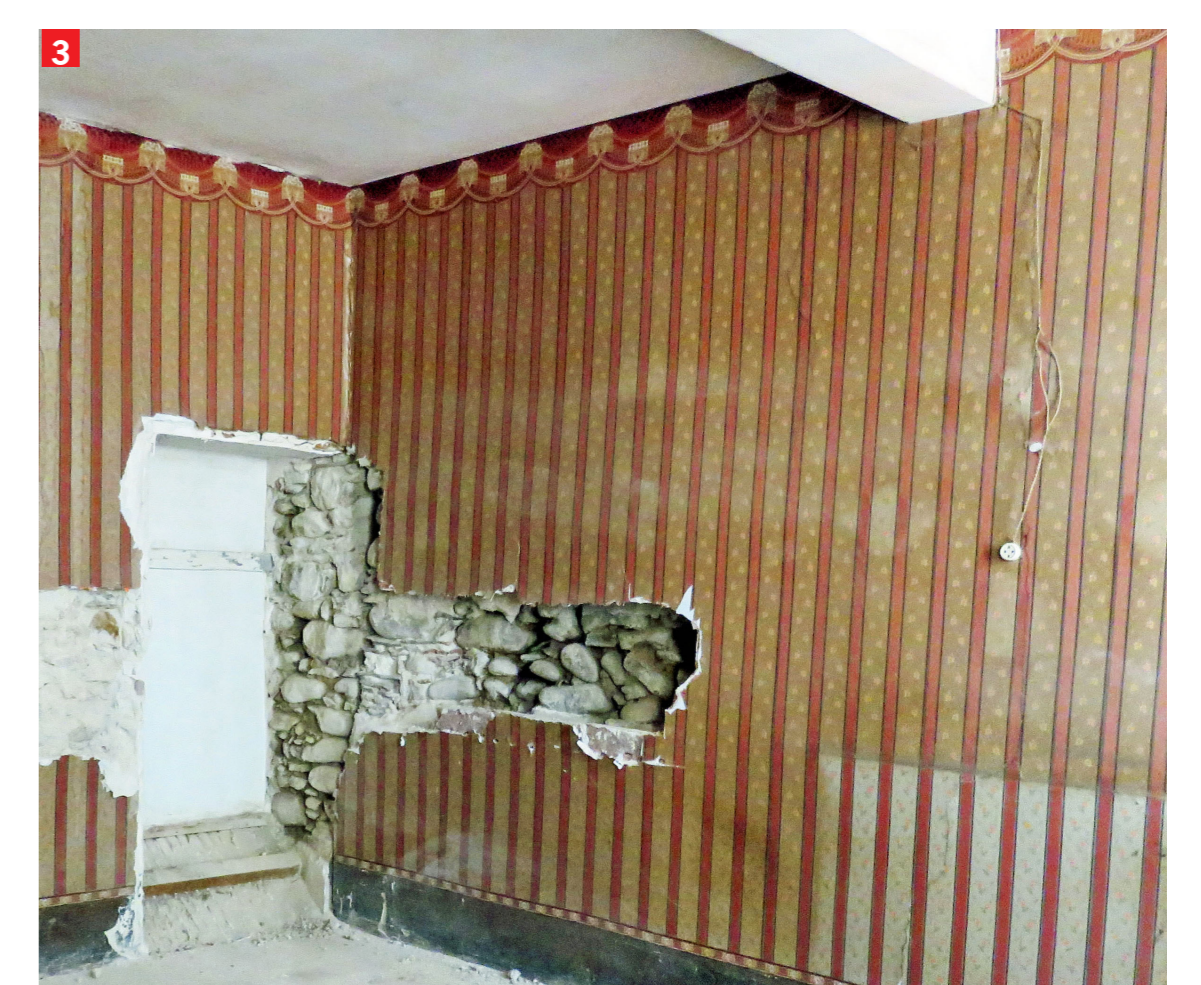
3 Salon du 1 er étage d'une bijouterie. Papier peint 1900 – Art nouveau. Identification et datation : Ph. de Fabry, Directeur du Musée européen du papier Peint de Rotheim.