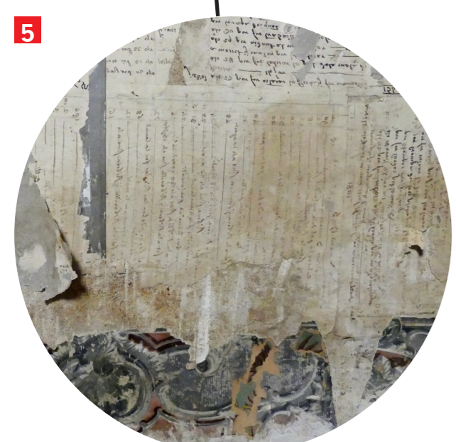
5 Livre de comptes (1801) employé comme maculature (couche d'apprêt) recouvert d'un papier peint avec son bas de lambris daté de 1830.

Datation papier peint : C. Vaxelaire, (Conservatrice du Musée européen du papier Peint de Rotheim).