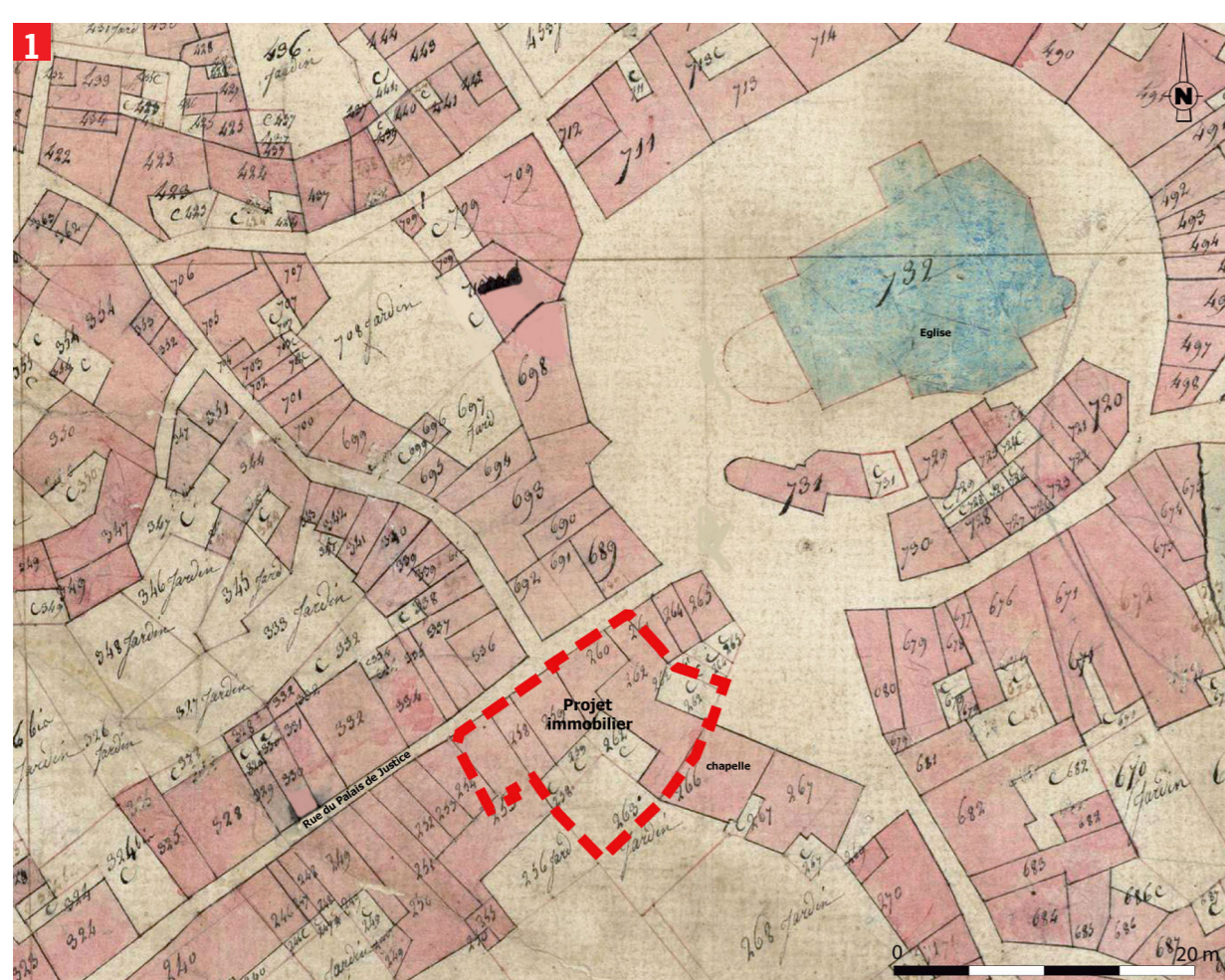
1 Les propriétés concernées par le projet immobilier de la ville de Prades sur le cadastre napoléonien de 1811. Source : Archives départementales des Pyrénées Orientales (ADPO, 21127/151). Infographie : C. Jandot (Inrap).