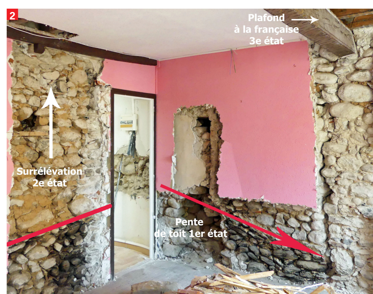
2 Identification de la pente de toit de la première cellule d'une maison médiévale, surélévation de toit d'un 2 e étage et rehaussement d'un 3 e étage doté d'un plafond à la française (abbatage survenu après 1537).