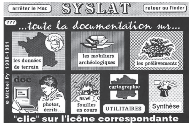
Fig. 1. Copie d'écran du menu principal de la pile de base du système documentaire Syslat.