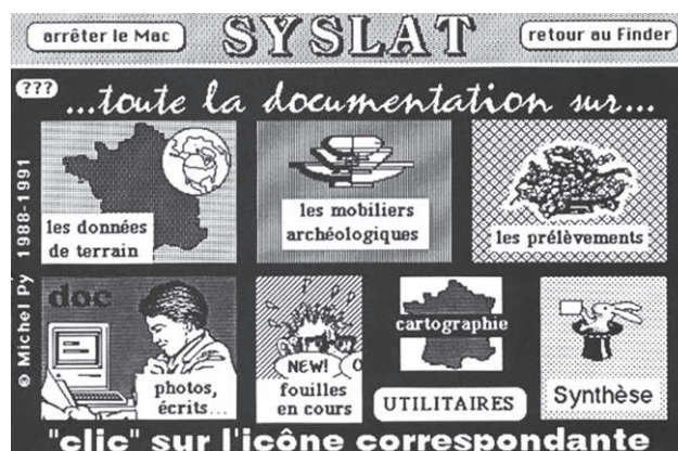
Fig. 1. Copie d'écran du menu principal de la pile de base du système documentaire Syslat.