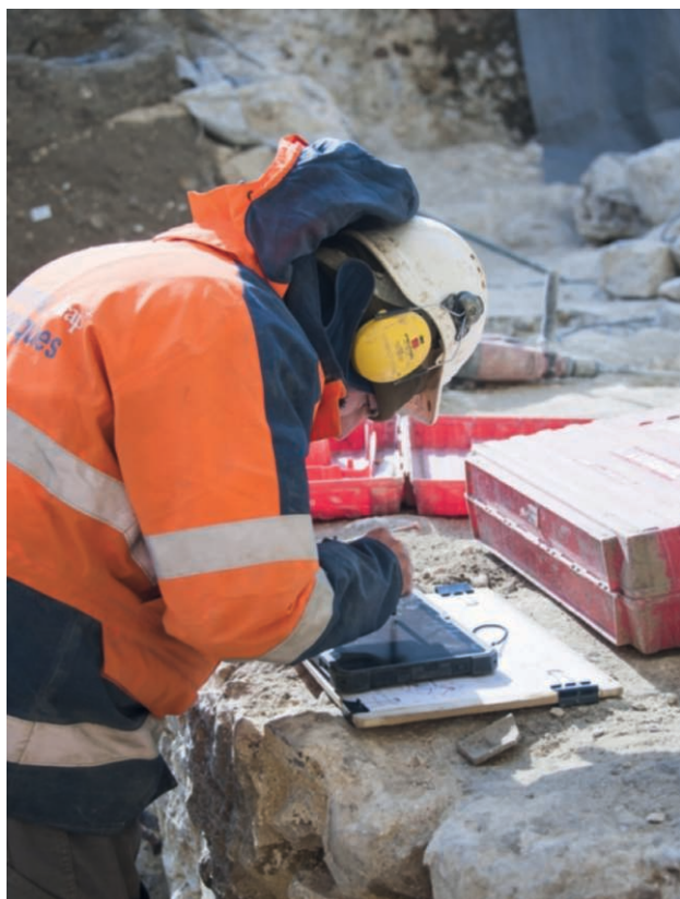
Fig. 3. Utilisation d'une tablette durcie sur le chantier de fouilles des jardins de la cathédrale du Mans (2017-2018).