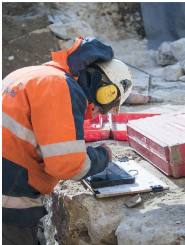
Fig. 3. Utilisation d'une tablette durcie sur le chantier de fouilles des jardins de la cathédrale du Mans (2017-2018).