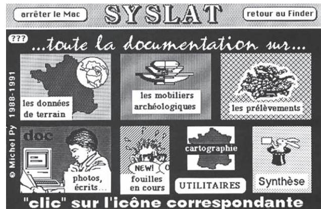
Fig. 1. Copie d'écran du menu principal de la pile de base du système documentaire Syslat.