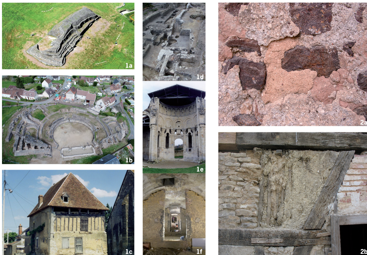
Fig. 1 - Exemples de la diversité des situations et des chronologies des constructions sur lesquelles on peut pratiquer des études archéologiques. a – Cairn de Barnenez (Côte d'Armor) ; b – Théâtre antique de Drevant (Cher) ; c – Bâti civil à Issoudun (Indre) ; d – Cave et vestiges de constructions antiques et médiévales mises au jour au cours des fouilles urbaines rue Robert Houdin à Blois (Loir-et-Cher) ; e – Vestiges du prieuré Saint-Léonard de L'Île-Bouchard (Indre-et-Loire) ; f – Citerne transformée en cave au château de Versailles (Yvelines).