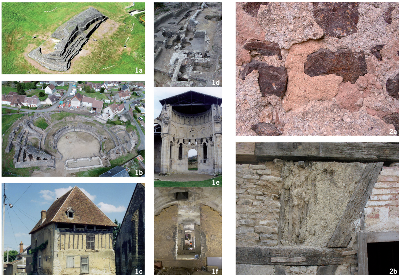
Fig. 1 - Exemples de la diversité des situations et des chronologies des constructions sur lesquelles on peut pratiquer des études archéologiques. a – Cairn de Barnenez (Côte d'Armor) ; b – Théâtre antique de Drevant (Cher) ; c – Bâti civil à Issoudun (Indre) ; d – Cave et vestiges de constructions antiques et médiévales mises au jour au cours des fouilles urbaines rue Robert Houdin à Blois (Loir-et-Cher) ; e – Vestiges du prieuré Saint-Léonard de L'Île-Bouchard (Indre-et-Loire) ; f – Citerne transformée en cave au château de Versailles (Yvelines).