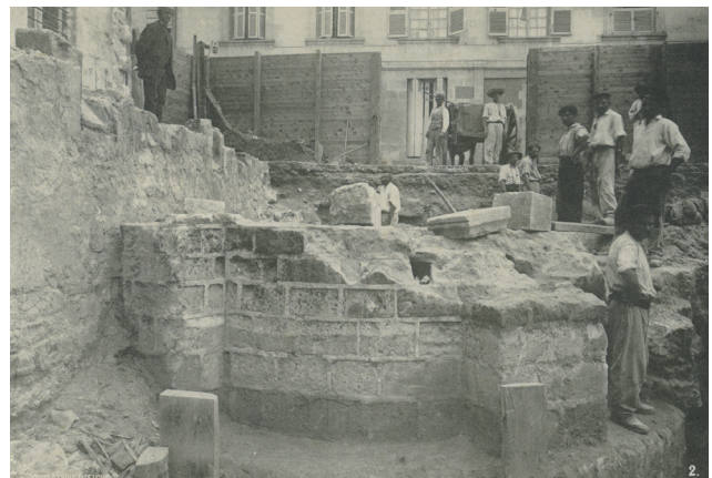
Fig. 2 et 2 bis. C. Peigné, Tours : vues du chantier de Saint-Martin à la fin de juillet 1886. Phototypies tirées de Chevalier 1888. En haut : un chef de chantier et ses ouvriers avec leurs outils prennent la pose au milieu des maçonneries de la collégiale, en cours de dégagement. En bas à droite, les vestiges du tombeau de Saint-Martin découverts en 1860 et protégés par une construction. En bas : les fouilleurs prennent la pose devant une chapelle de la collégiale, dégagée jusqu'à ses fondations bien visibles.

lors de la Seconde Guerre mondiale puis d'autres rasées ou déformées par les travaux d'urbanisme des années 1960-1980, les documents iconographiques permettent d'étudier les modalités et les évolutions du bâti urbain. Les constructions à pan de bois, majoritaires dans la ville avant le passage à la pierre au XVIII e siècle, peuvent être analysées dans le détail alors que leur corpus d'origine a été fortement amputé (Noblet 2018).