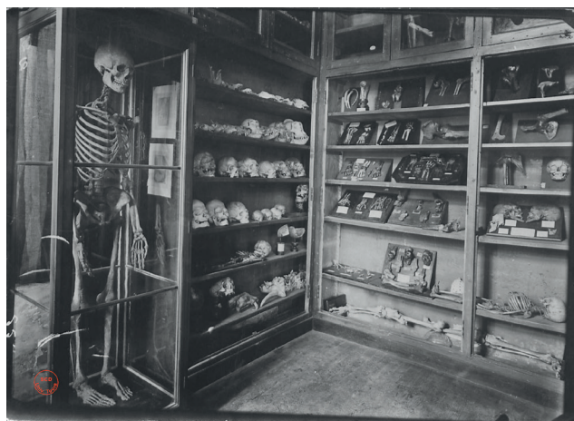
Fig. 10. Musée d'ostéologie de l'École de Médecine et de Pharmacie de Tours. N° 15, s. d. Tirage papier © SCD (Service commun de documentation), Université de Tours, méd Fi9-2-1. Les fouilles de la Zone d'aménagement concerté (ZAC) sur les anciennes casernes de Beaumont-Chauveau, à Tours, ont livré une série d'inhumations atypiques, de corps lacunaires. Elles sont liées aux séances de dissection de l'école de Médecine, toute proche, à la fin du XIX e et au début du XX e siècle. Ici, les restes exposés proviennent certainement de ces mêmes activités d'enseignement.

Tout particulièrement en ville, où l'activité humaine est intense, la photographie offre des constats d'état,