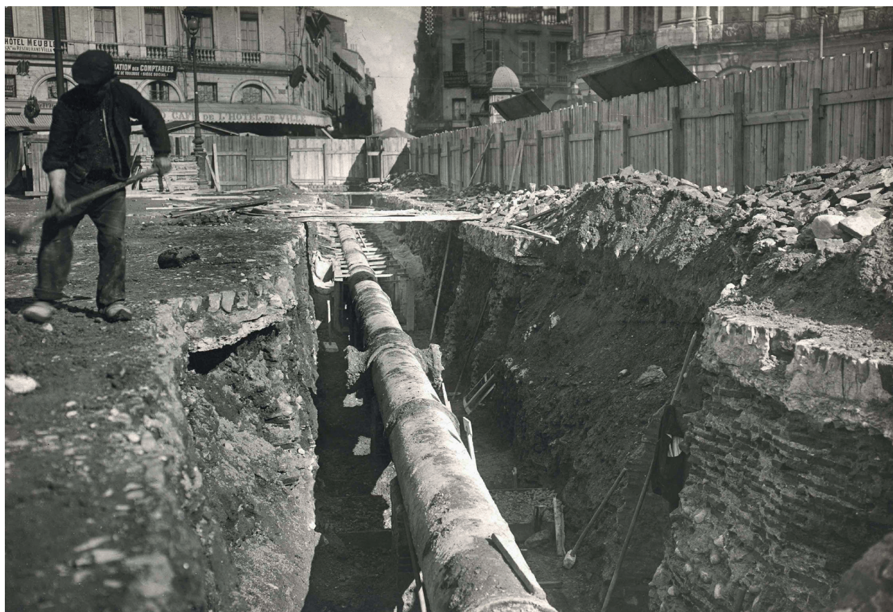
Fig. 8. L. Fachinetti, Toulouse : pose de canalisation d'égouts place du Capitole, 1910. Tirage papier, 11x16 cm. © Archives municipales de Toulouse, 1 Fi234. Extrait d'un lot d'images de travaux de canalisation au cours desquels des éléments de l'enceinte antique, ici en bas à droite, ont été dégagés et observés par les membres de la Société archéologique du Midi de la France.