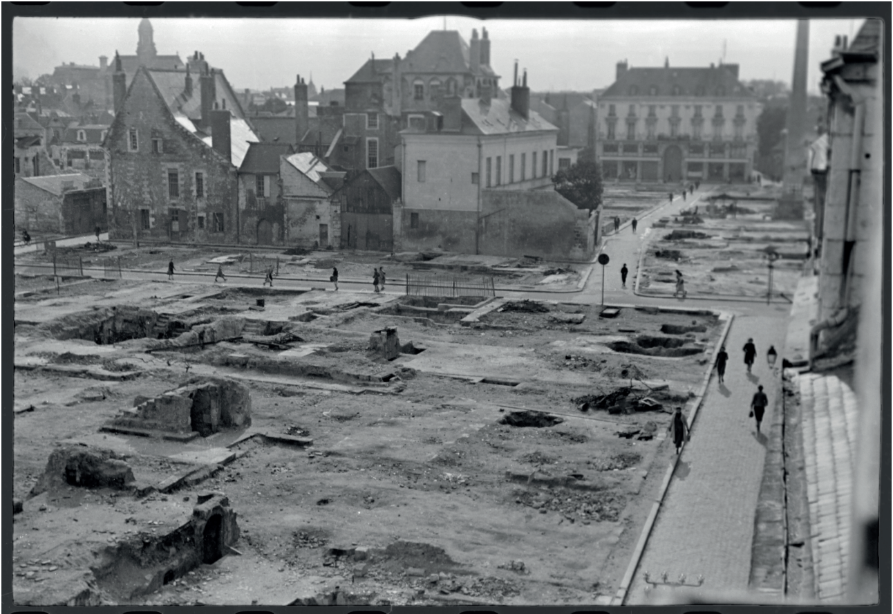
Fig. 7. A. Arsicaud, Tours : îlots en ruine rue des Halles , 13 mai 1948. Négatif nitrate, 2,4x3,6 cm. , 5 Fi007778. Au premier plan, les vestiges de fondations des bâtiments détruits durant la guerre (maçonneries, escaliers, caves). Au second plan, un îlot préservé dont une maison-tour du xii e siècle, démolie lors des reconstructions.

services d'inventaire, plus récemment, contribuent largement à poursuivre cette œuvre photographique (Auduc 2013) et leurs ressources s'avèrent de véritables mines d'information pour l'archéologue.