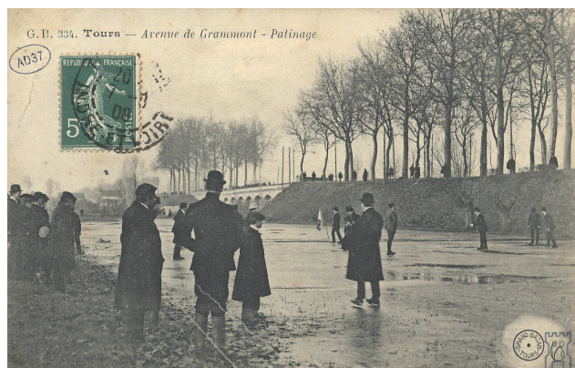
Fig. 9. Grand Bazar, 334. Tours - Avenue de Grammont - Patinage , avant 1908. Phototypie, 8,9x13,9 cm. © Archives départementales d'Indre-et-Loire, 10 Fi261-1218.