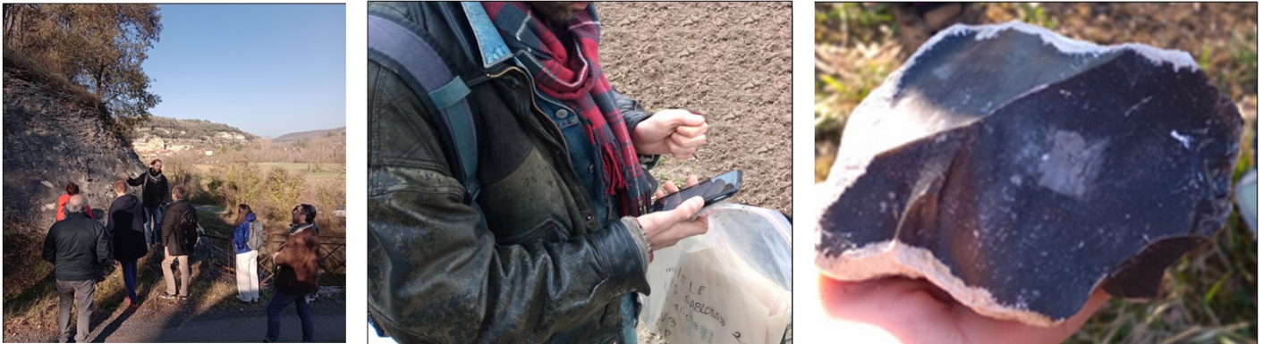
Figure 1 : Formation sur la géolocalisation et la cartographie : utilisation de l'application mobile devant une formation à silicite, et photo d'un échantillon de matériau siliceux

terrain en situation réelle (figure 1). Une fois la formation réalisée, les participants sont autonomes dans la saisie de points avec l'application mobile ou dans sa version Web sur le terrain ou en laboratoire et de pouvoir accéder à toutes les données sur les formations à silicites et sur les gîtes.