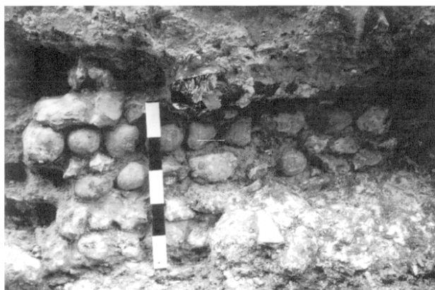
Fig. 2 : système de fondation aménagé de rognons de silex calibrés.