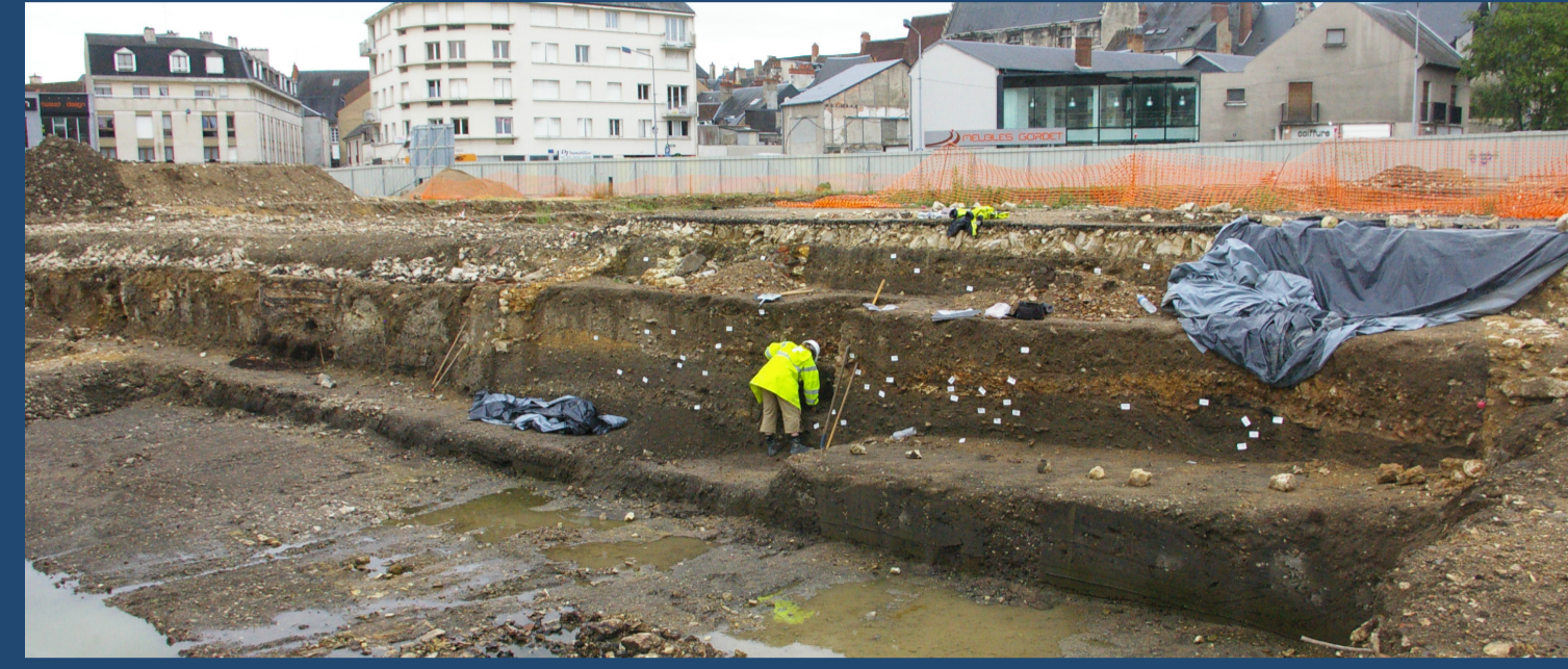
Terres noires en cours de prélèvement depuis une coupe, ZAC Avaricum (fouille préventive)

Lors des fouilles, ces niveaux ont été appréhendés en couplant une approche archéologique classique (fouille fine, enregistrement, stratigraphie) et une démarche géoarchéologique (description macroscopique fine et étude en séquences, tests chimiques, colorimétrie). En post-fouille, les études stratigraphiques et mobilières ont également été associées à la micromorphologie, la géochimie, la palynologie, la microarchéologie, etc.