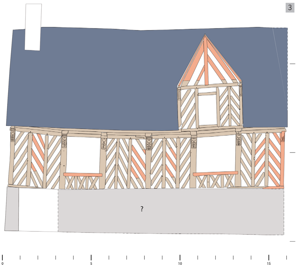
Fig. 3 - 25-27 rue de Penhoët : restitution de la façade sur rue.

L'étude en archives confrontée aux observations de terrain a permis de découvrir la fonction de ce bâtiment aux volumes et à l'architecture particulière. Il s'agit d'une ancienne auberge dont le rez-de-chaussée était occupé par les écuries tandis que la vaste salle à l'étage servait de salle de repas [fig.3]. Le premier niveau était dépourvu de cheminée alors que l'étage constitué d'une grande salle était éclairé par de larges baies dont les encadrements étaient richement décorés. Une cheminée monumentale complétait le tout. Les textes ont également confirmé les dates de construction de [1578-79d] proposées par la dendrochronologie. Ce bâtiment a ensuite évolué avec l'ajout d'une aile en retour occupée par des chambres supplémentaires. Cette auberge a été en activité jusqu'à la fin du XVIII e siècle, transformée par la suite en boutiques et logements.