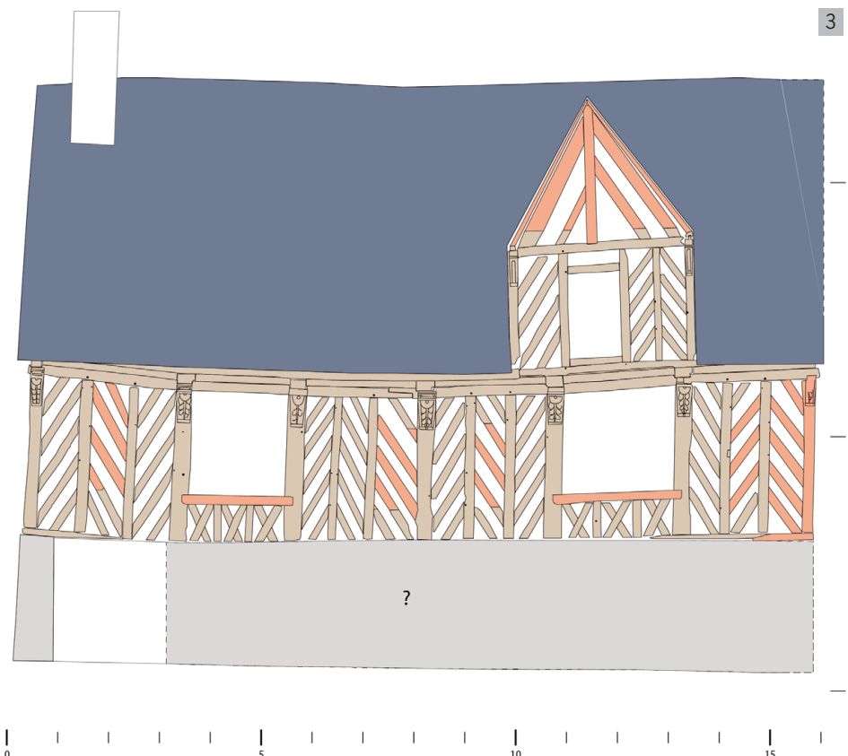
Fig. 3 - 25-27 rue de Penhoët : restitution de la façade sur rue.

L'étude en archives confrontée aux observations de terrain a permis de découvrir la fonction de ce bâtiment aux volumes et à l'architecture particulière. Il s'agit d'une ancienne auberge dont le rez-de-chaussée était occupé par les écuries tandis que la vaste salle à l'étage servait de salle de repas [fig.3]. Le premier niveau était dépourvu de cheminée alors que l'étage constitué d'une grande salle était éclairé par de larges baies dont les encadrements étaient richement décorés. Une cheminée monumentale complétait le tout. Les textes ont également confirmé les dates de construction de [1578-79d] proposées par la dendrochronologie. Ce bâtiment a ensuite évolué avec l'ajout d'une aile en retour occupée par des chambres supplémentaires. Cette auberge a été en activité jusqu'à la fin du XVIII e siècle, transformée par la suite en boutiques et logements.